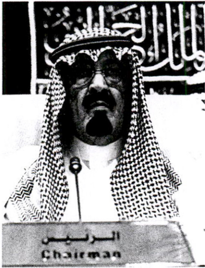
خادم الحرمين الشريفين يضع حجر الأساس لـ"مدينة الملك عبدالله الاقتصادية"

دشن خادم الحرمين الشريفين الملك عبدالله بن عبدالعزيز مشروع "مدينة الملك عبدالله الاقتصادية". ويعد المشروع من أكبر المشاريع الاقتصادية في المملكة، وستبنى هذه المدينة المتكاملة على مساحة ٥٥ مليون متر مربع بكلفة ١٠٠ بليون ريال. وسينفذ المشروع بموازة شاطئٍ يمتد على طول ٢٥ كلم في موقع استراتيجي بين مكة والمدينة المنورة ومدينة جدة، وستكون المدينة واحدة من أهم التجمعات الاقتصادية المتكاملة على مستوى العالم، ومن بين المشاريع التي تتضمنها مدينة الملك عبدالله، ميناء يفوق حجمه عشر مرات أكبر موانئ العالم، إضافة إلى منطقة صناعية لقطاعات البتروكيماويات.