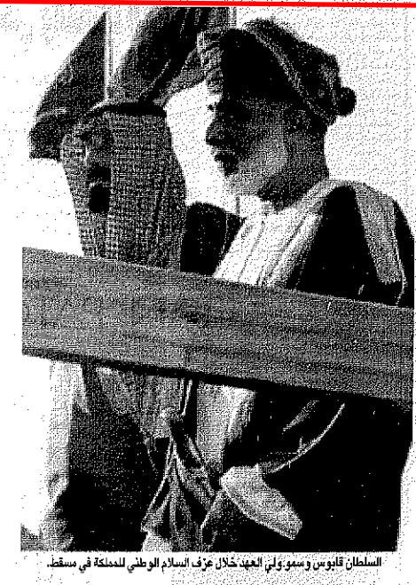
السلطان قابوس وسمو ولي العهد خلال عزم السلام الوطني للمملكة في مسقط

قام صاحب السمو الملكي الامير عبدالله بن عبدالعزيز وولي العهد نائب رئيس مجلس الوزراء ورئيس الحرس الوطني مساء امس بزيارة الى اخيه صاحب السمو الشيخ عيسى بن سلمان آل خليفة أمير دولة البحرين الشقيقة بمقر إقامة سموه في فندق قصر البستان بمسقط. وحضر الاستقبال الوالد المرافق لسمو ولي العهد والوفد العراقي لسمو أمير البحرين. كما قام سموه مساء امس بزيارة لاخته صاحب السمو الشيخ زايد بن سلطان آل نهيان رئيس دولة الامارات العربية المتحدة في مقر إقامة سموه بفندق قصر البستان في مسقط. وحضر الاستقبال الوالد المرافق لسمو ولي العهد والوفد العراقي لسمو أمير البحرين زايد بن سلطان آل نهيان. كما استقبل سمو الشيخ عيسى بن سلمان آل خليفة أمير دولة البحرين امس بمقر إقامة سموه بفندق قصر البستان في مسقط سمو الشيخ حمد بن خليفة آل ثاني أمير دولة قطر. وقد جرى خلال المقابلة استعراض جدول اعمال القمة السادسة عشرة لقادة مجلس التعاون لدول الخليج العربية