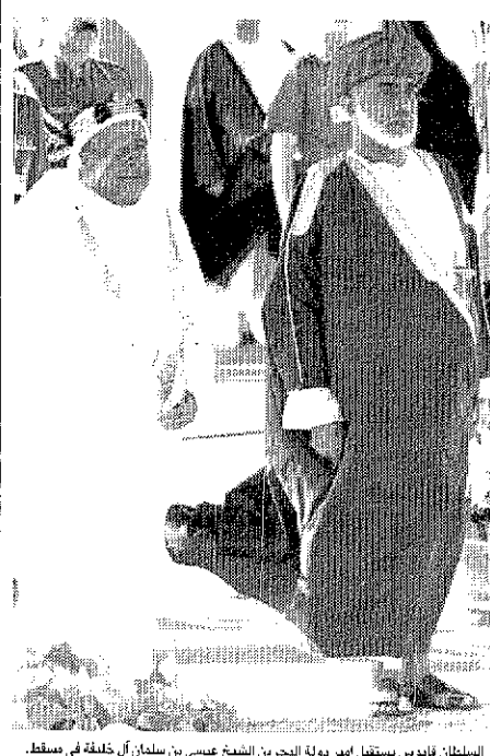
السلطان قابوس يستقبل امير دولة البحرين الشيخ عيسى بن سلمان آل خليفة في مسقط