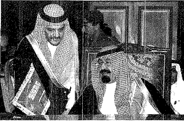
سمو ولي العهد يراس وفد المملكة في مؤتمر القمة بمسقط