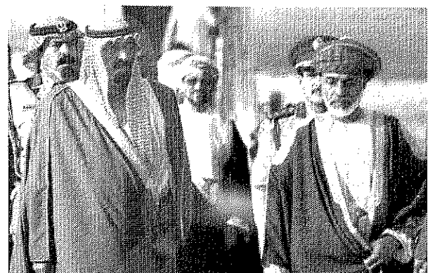
السلطان قابوس في مقدمة مستقبلي سمو ولي العهد