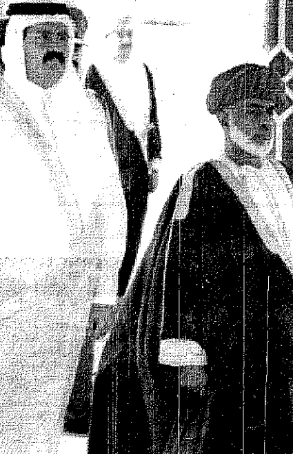
السلطان قابوس يستقبل الشيخ حمد بن خليفة