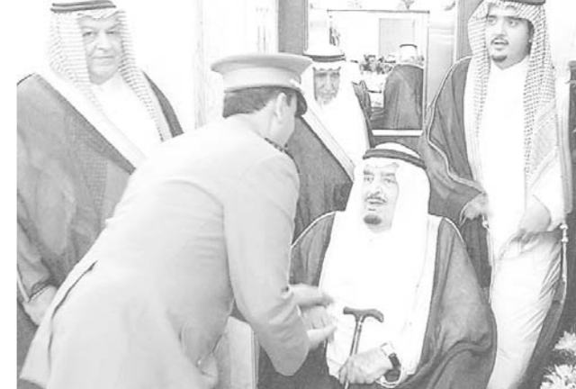
مدير الامن العام يتشرف بالسلام على خادم الحرمين الشريفين

تشرف بالسلام على خادم الحرمين الشريفين الملك فهد بن عبدالعزيز آل سعود - حفظه الله- في مكتبه بديوان رئاسة مجلس الوزراء أمس مدير الامن العام الفريق سعيد بن عبدالله القحطاني وذلك بمناسبة تعيينه مديراً للأمن العام. وقد استمع الفريق القحطاني الى توجيهات خادم الحرمين الشريفين التي حثه من خلالها وزملاءه من رجال الأمن العام على أداء الدور المناط بهم لخدمة وطنهم ومواطنيهم على الوجه الاكمل مراعين الله سبحانه وتعالى في كل تصرفاتهم وأعمالهم متمنيا لهم التوفيق والسداد.