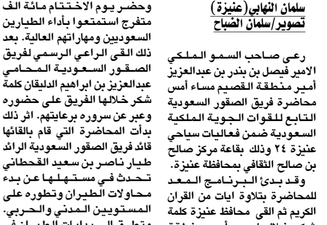
سموه يكرم افراد فريق الصقور