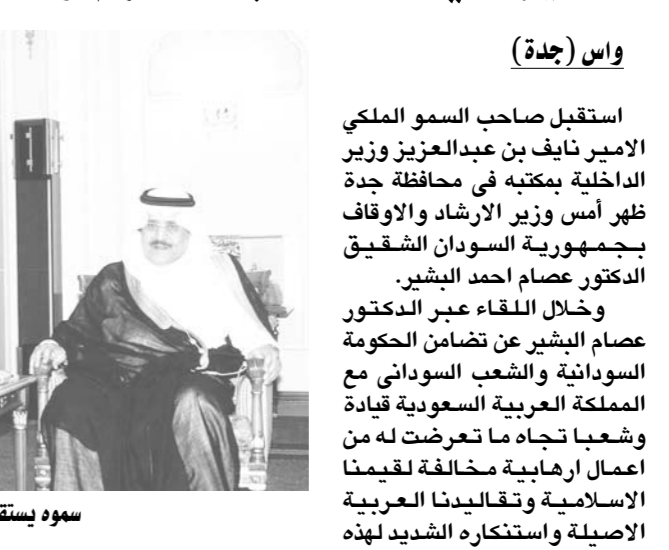
سموه يستقبل د. البشير