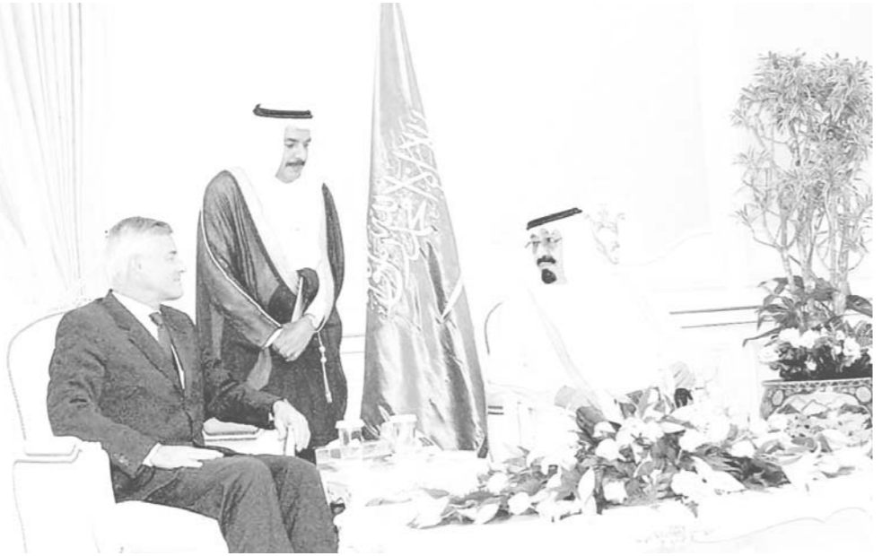
ويستقبل مبعوث الأمم المتحدة

الملك الامير متعب بن عبدالعزيز وزير الشؤون البلدية والقروية وصاحب السمو الامير الدكتور بندر بن سلمان بن محمد آل سعود المستشار في ديوان سمو ولي العهد ووزير المياه والكهرباء الدكتور غازي بن عبدالرحمن القصيبي من جهة أخرى يقوم سمو الامير عبدالله بن عبدالعزيز اليوم بزيارات لأصحاب السماحة والفضيلة العلماء وذلك جريا على عادة سموه يحفظه الله. ومن المتوقع ان يفتتح سموه ويضع حجر الأساس لعدد من المشاريع التنموية يومي غدا الاثنين وبعد غد الثلاثاء.