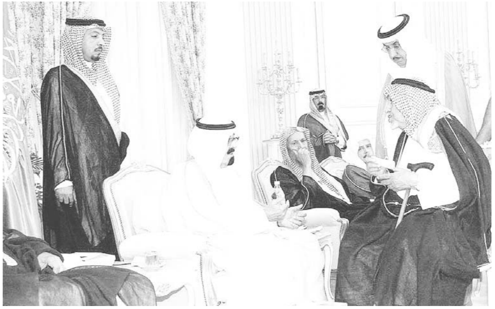
سمو ولي العهد يستقبل الأمراء والعلماء ومشايخ القبائل

عبدالرحمن الخنشار - عبدالعزيز التبيتي (واس) - الطائف