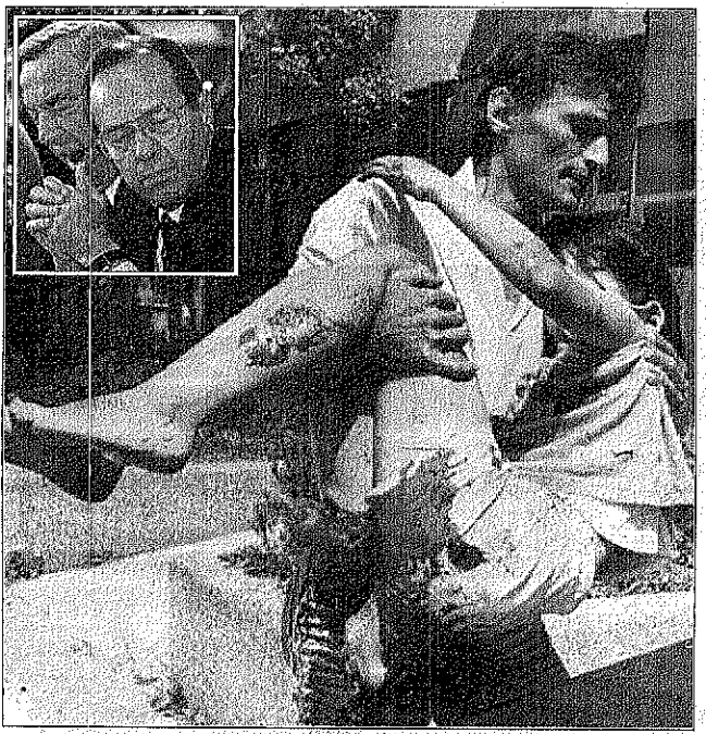
الجرحى من الدماء تسبل في البوسنة مع تزويد الكصف والتشريح، وفي الاطار وزيراً خارجية ووقاع أمريكا في اجتماع لندن لحل أزمة البوسنة