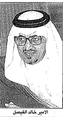
الأمير خالد الفيصل

كتب: قتيان الغامدي صاحب السمو الملكي الأمير خالد الفيصل أمير منطقة عسير قال إن المشاريع السياحية في المنطقة حققت نجاحا كبيرا في السنوات الماضية وحظيت بإقبال كثيف من السياح والمصنفين، مشيراً سموه إلى أن نجاح المشروعات السياحية جاء ثمرة لامتلاك أسس التنمية من طرق وتجهيزات وماء وكافة الخدمات الأخرى، وقال سموه في حديث خاص ل«عكاظ» إن مشاريع التنمية في عسير كلفت الدولة من الجهد والوقت والمال أضعاف أمثالها في مناطق المملكة الأخرى بحكم طبيعتها الجغرافية مؤكداً سموه أن عزم وتصميم ودعم خادم الحرمين الشريفين - حفظه الله - ذل كل مصاعب التنمية، ويحقق للمنطقة في ٢٤ عاماً ما كان يحتاج تحقيقه لقرن كامل، وأشاد سمو الأمير خالد الفيصل بظهور رجال الأعمال في مجال الاستثمار السياحي، وقال إن الدولة لم تتخرب جهداً في سبيل تشجيعهم وذلك بتقديم كافة التسهيلات والقروض، والأراضي الصالحة للاستثمار، وقيل ذلك تجويز البنية الأساسية اللازمة لانطلاق المشاريع، وأضاف سموه بأن النجاح الذي حققته المشاريع الاستثمارية تشجع رجال الأعمال على المضي قدماً في هذا الميدان ورمزت السياحة الداخلية تشجيع المزيد والمزيد من الاستثمارات التي ستحقق نجاحات أكبر، وقال سموه إن السياحة أصبحت صناعة متطورة ومتزايدة تزداد الاستثمار فيها يعني عوائد وفرص كبيرة مشيراً سموه إلى أن هناك دولا كثيرة تعتمد على السياحة كدخل قومي بل ربما لا يوجد لديها سواها، وأوضح سموه أنه خلال خمس سنوات تقريبا ستشكل السياحة الداخلية مورداً اقتصادياً هاماً.