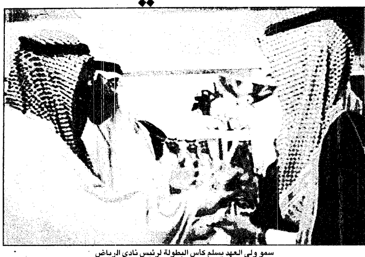
سمو ولي العهد يسلم كأس البطولة لرئيس نادي الرياض