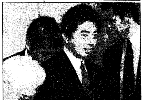
هوسوكاوا يتأهب للخروج لاجل استقالته