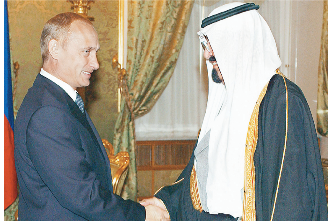
سمو ولي العهد يصافح الرئيس بوتين سمو الأمير عبدالله يستعرض حرس الشرف لدى وصوله الى موسكو

وعلمت «عكاظ» من مصادر روسية ان الرئيس بوتين أبدى رغبة أكيدة في اتمام هذه الزيارة قبل نهاية العام الميلادي.