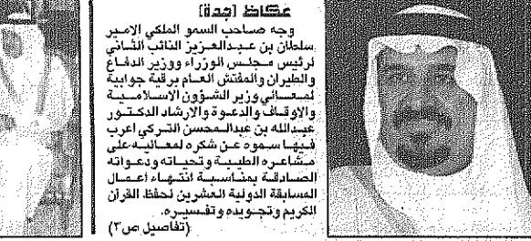
سمو النائب الثاني يشكر التركي

وجه صاحب السمو الملكي الامير سلطان بن عبدالعزيز النائب الثاني لرئيس مجلس الوزراء وزير الدفاع والطيران والمفتش العام برقية جارية لمحامي وزير الشؤون الاسلامية والاوقاف والدعوة والارشاد الدكتور عبدالله بن عبدالحسين التركي اعرب فيها سموه عن شكره لمعاليه على مشاغره الطبية وحنانيته ودعمه الصادقة بمناسبة انتهاء اعمال المسابقة الدولية العشرين في حفظ القرآن الكريم وتجويدوه وتقديره.