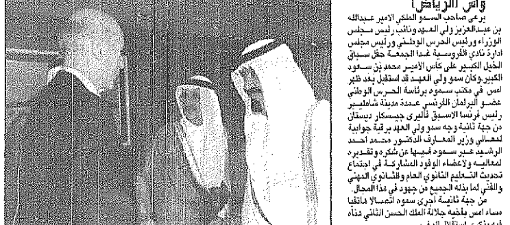
سمو ولي العهد لدى استقباله ديستان

استقبل صاحب السمو الملكي الامير عبدالله بن عبدالعزيز ولي العهد نائب رئيس مجلس الوزراء ورئيس الحرس الوطني ورئيس مجلس ادارة نادي القوسية غدا الجمعة حفل سباق الخيل الكبير على كاس الامير محمد بن سعود الكبير وكان سمو ولي العهد قد استقبل بعد ظهر امس في مكتب سموه برئاسة الحرس الوطني عضو البرلمان الفرنسي عمدة مدينة شامبيري رئيس فرنسا الاسبق تاليري جيسكار ديستان من جهة ثانية ووجه سمو ولي العهد برقية جارية لمعارف وزير المعارف الدكتور محمد احمد الرشيد عبر سموه فيها عن شكره وتقديره لمعارف ولاعضاء الوفود المشاركة في اجتماع تحديث التعليم العالي في الامارات العربية المتحدة في دبي في هذا المجال. مساء امس باضحة جلاله الملك الحسن الثاني نداه في بذكره استقبل المغرب.