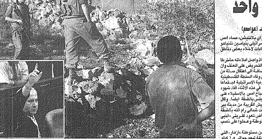
مزارع فلسطيني يراقب حراقة اسر المصلحة تعمل على شق طريق لمستعمرة يهودية، غرب تلخيس عبر حقول الزيتون التي يملكها العرب وفي الاطار تفتياهم اثناء التصويت على الاتفاق

استقبل صاحب السمو الملكي الامير ماجد بن عبدالعزيز امير منطقة مكة المكرمة امس رئيس مجلس نادي الاتحاد بجدة وعضواه وقيادته فريق كرة القدم لنادي الاتحاد الذي تبارع في زيارته للاعبين حيث قدموا لسموه كاس الاتحاد السعودي لكرة القدم الذي حصلوا عليه الاسبوع الماضي عقب فوزهم في المباراة النهائية على فريق الشباب في جدة. وهدى سموه الازار والاحادية والملايين بهذه المناسبة داعياً لاعبيهم مضاعفة العطاء من اجل الحصول على البطولات القادمة وتكرار الثلاثية وبدا سموه لنادي الاتحاد ولجنة الاندية بالقدوم والتوفيق وطلب كل اللاعبين بين الجهود حتى يواصلوا شرف الكرة السعودية في المسابقات المحلية والخليجية والاحادية الودية.