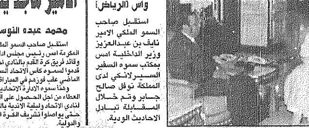
الامير نايف يستقبل السفير السيرلانكي

استقبل صاحب السمو الملكي الامير نايف بن عبدالعزيز وزير الداخلية امس في مكتبه سموه السفير السيرلانكي لدى المملكة نولف صالح جيسار وتم خلال الاستقبال تبادل الاحاديث الودية.