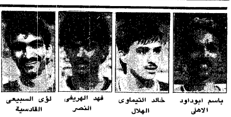
ثلاثة لقاءات في لوزي كاس خادم الحرمين .. اليوم

عبدالله الشبيخي - جدة : تجري اليوم ضمن مباريات الاسبوع الحادي عشر في مسابقة لوزي كاس خادم الحرمين الشريفين ثلاث مباريات . ففي جده يلتقي الاهل والهلال على ملعب رعاية الشباب في مباراة هامة سينقلها التلفزيون السعودي عبر قناة الاولى الساعة السابعة والنصف مساء . وفي الرياض يلتقي النصر والعربي في مباراة سهلة لتعريف النصر ويستثمر فريق الوحدة والقادسية مباريات اليوم بلقاءهما الذي يقام على ملعب مدينة الملك عبدالعزيز الرياضية في مكة المكرمة مساء . ( تفاصيل عكاظ الرياضية )