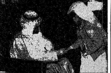
سمو ولي العهد يستقبل جموعا من المواطنين

د. ب. ا (لندن) : اعترضت السفن الحربية الاميركية والبريطانية والاسترالية سفينة شحن في الخليج اس اس اريهان للاشياء في انها تحمل شحنة من السكر الى العراق انتهاكا للحظر الذي تفرضه الامم المتحدة على العراق .