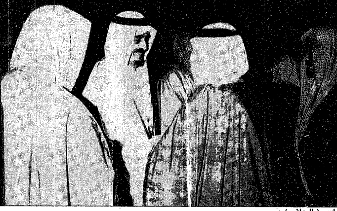
واس (الرياض) : استقبل خادم الحرمين الشريفين الملك فهد بن عبدالعزيز بالديوان الملكي بقصر اليمامة بعد ظهر امس اصحاب القضية العلماء والمشايخ وجموعا من المواطنين وحضر الاستقبال اصحاب السمو الامراء .