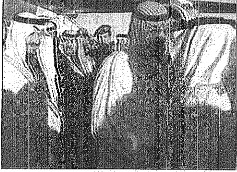
سمو ولي العهد لدى وصوله الرياض