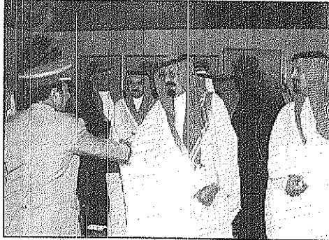
سمو ولي العهد لدى مغادرته جدة في طريقه الى الرياض