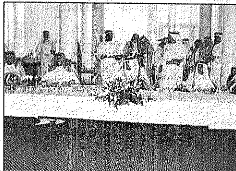
الملك يلقي محفل غداء لآخيه سمو الامير عبدالله