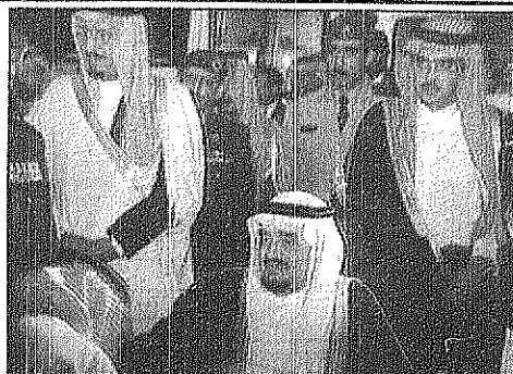
خادم الحرمين الشريفين لدى وصوله الرياض وسمو ولي العهد في مقدمة مستقبليه