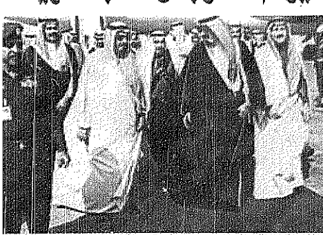
سمو الأمير عبدالله يصل الرياض قادمًا من جدة

عكاظ-واس-الرياض نيابة عن خادم الحرمين الشريفين الملك فهد بن عبدالعزيز آل سعود -يحفظه الله- يتفضل بمشيشة الله تعالى صاحب السمو الملكي الأمير عبدالله بن عبدالعزيز ولي العهد نائب رئيس مجلس الوزراء ورئيس الحرس الوطني برعاية افتتاح المهرجان الوطني للتراث والثقافة الذي اعتاد الحرس الوطني إقامة سنويًا في الجنادرية وذلك بعد عصر اليوم الأربعاء. هذا وقد وجه صاحب السمو الملكي الأمير فهد بن عبدالعزيز نائب رئيس الحرس الوطني ورئيس اللجنة العليا المنظمة للمهرجان الدعوة لأصحاب السمو الملكي الأمراء والمعالي الوزراء والى عدد من رجال الثقافة والفكر والادب في عدد من الدول الإسلامية والعربية والأوروبية وفي المملكة لحضور هذا المهرجان التراثي الكبير. وسيدنا حفل الافتتاح سيبدأ اليوم الساعة العاشرة صباحًا في تمام الزاوية والنصف عصرًا وسيقدم سمو ولي العهد الجوائز للفائزين. وأدى سمو الأمير فهد بن عبدالعزيز بتصريح قبل فة ان اهتمامه ورعايته خادم الحرمين الشريفين وسمو ولي عهده الأمين بالبلاد الغالية من خادم الحرمين الشريفين وهي اهتمامه بالرعاية والدمج بينه -يحفظه الله- ومن سمو ولي العهد الأمين للفكر والثقافة والتراث، هذا وقد وصل يحفظ الله ورعايته صاحب السمو الملكي الأمير عبدالله بن عبدالعزيز ولي العهد نائب رئيس مجلس الوزراء ورئيس الحرس الوطني الى الرياض آمنًا فاستأمن من جدة. (مقاصيل ص ٢٢، ٢١، ٢٢)