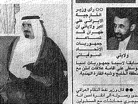
الأمير ماجد يستقبل الأمير محمد بن طلال

خلف الغامدي- مكة المكرمة صاحب السمو الملكي الأمير ماجد بن عبدالعزيز أمير منطقة مكة المكرمة استقبل بقصر سموه في جدة يوم امس صاحب السمو الملكي الأمير محمد بن طلال شقيق جلالة الملك حسين بن طلال ملك الأردن، وحضر اللقاء الاستاذ محمد علي الطاهري المدير العام في جدة. الأمير محمد بن فهد: المملكة مشهنة بتخريف القطاع الخاص ناصر الحسين- الدمام اشاد صاحب السمو الملكي الأمير محمد بن فهد بن عبدالعزيز أمير المنطقة الشرقية بالانتماء الكبير الذي توليه حكومة خادم الحرمين الشريفين الملك فهد بن عبدالعزيز -يحفظه الله- لتشييد البنية الاساسية في البلاد، وقال سموه في الكلمة التي القاها امام المسؤولين ورجال الاعمال في افتتاحه لندوة اقتصاديات دول مجلس التعاون الخليجي في صراحيه للتكامل الاقتصادية الاقتصادية والدمية، ان الحكومة بارتباطها بالعمل على تقوية الاقتصاد الوطني وتوقيع مواءم المحل وذلك بتخريف القطاع الخاص ليقيم بدور اكبر في تنفيذ المشروعات الانتاجية والخدمية في كافة المجالات تشكر بنينا على سبيل المثال قطاعات الصناعة والتعدين بالإضافة الى توسيع دائرة امتلاكه وإدارته المنشآت العامة. مقاصيل ص ٥