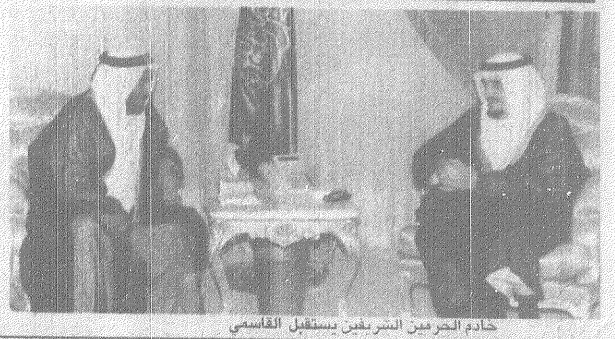
خادم الحرمين الشريفين يستقبل القاسمي

خادم الحرمين الشريفين يستقبل القاسمي [واس - مكة المكرمة] [٥] استقبل خادم الحرمين الشريفين الملك فهد بن عبدالعزيز آل سعود - حفظه الله - في مكتبه بالديوان الملكي بصحبة الصفا في مكة المكرمة أمس صاحب السمو الشيخ الدكتور سلطان بن محمد القاسمي عضو المجلس الأعلى بنبولة الإمارات العربية المتحدة حاكم الشارقة والوفد المرافق له.