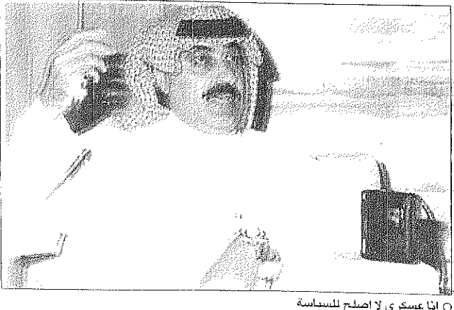
انا عسكري لا اصالح للسياسة