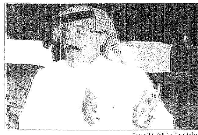
دائماً ابحت عن الفكرة الجديدة