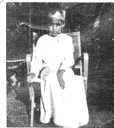
سومو في لقطه نادرة أثناء وجوده في قرية العليا - موطن طفولته