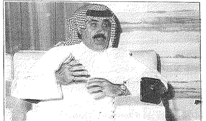
○ الجنادرية ارتبطت بالرياض وانا لا اکتتم على مشروعتها القادمة