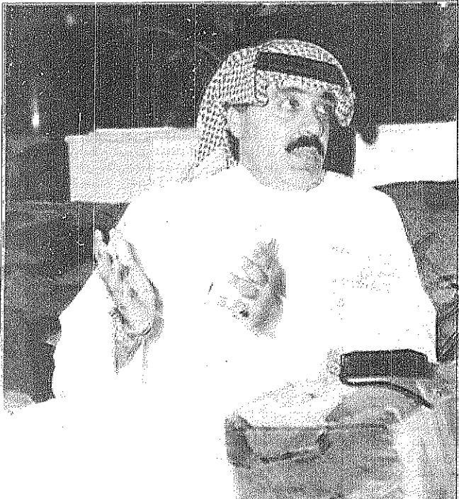
○ الجنادرية وطلت علاقتي بعيد الرب ادريس.. ومحمد عبده وعبدالمجيد اخوان وصديقان