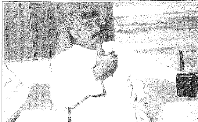
○ الوالدة تحملت وصبرت حتى وصلت الى ما انا عليه