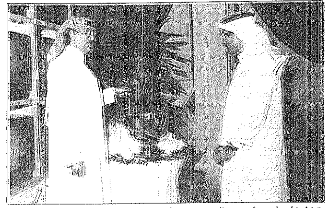
○ اخر كاس فروسية حصده الامير متعب بينه والزميل امين