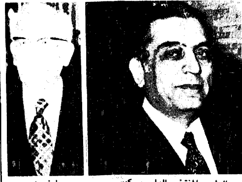
الرئيس المنتخب الياس سرکيس

أفضليات تجارية أمريكية لبعض دول «الأميبيك» واشنطن - وكالات الأنباء - وافقت لجنة تابعة لمجلس الشيوخ الأمريكي على تشريع من شأنه السماح بمنح بعض الدول الأعضاء في منظمة الدول المصدرة للبترول «اوبك» أفضليات تجارية كانت قد حرمت منها بموجب القانون الأمريكي.