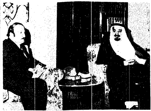
الملك خالد يبحث مع زيد الرفاعي الأوضاع الراهنة في الوقت الحاضر وخاصة قضية لبنان

بدأ تفريغ الاسمنت بالطائرات العمودية بدأ أمس في ميناء جدة تفريغ الاسمنت من اليواخز بواسطة الطائرات العمودية وتبدأ العملية باستخدام طائرتين كمرحلة أولية ثم يزداد العدد بعد شهر