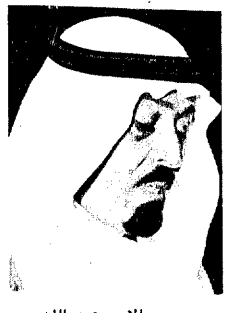
سمو الامير عبد الله

الرياض ١٠ - وافق صاحب السمو الملكي الامير عبد الله بن عبد العزيز نائب الثاني لرئيس مجلس الوزراء ورئيس الحرس الوطني على فتح عشر مدارس جديدة في مختلف مدن المملكة وذلك للعام الدراسي ١٤٢٧ / ١٤٢٨ هـ لمحو الامية وتعليم الكبار لمنسوبي الحرس الوطني.