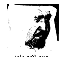
سمو الامير ماجد

الرياض ١٠ - وافق صاحب السمو الملكي الامير ماجد بن عبد العزيز وزير الشؤون البلدية والقروية على ترسية عدد من مشروعات البلديات تبلغ تكلفتها ٢٠ مليوناً و ١٤٧ الفا و ٤٧٥ ريالاً.