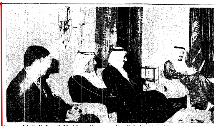
جلالة الملك العظيم يستقبل وزراء دول الخليج العربي لؤتمر الشركة العربية للملاحة البحرية

تتويج جوان كارلوس ملكاً على أسبانيا ● مدريد - وكالات الأنباء - استقرت المراسم الدينية لتتويج الملك جوان كارلوس ملك أسبانيا الجديد ، ساعة كاملة. وحضر الكاردينال فيسنت تاراكون رئيس أساقفة مدريد الملك الجديد من أخطار المرحلة التي تمر بها البلاد. وبعد انتهاء مراسم التتويج استقبلت الجماهير الإسبانية ملكها بالهفاوة والتصفيق ( أفرا صلحة ٢ )