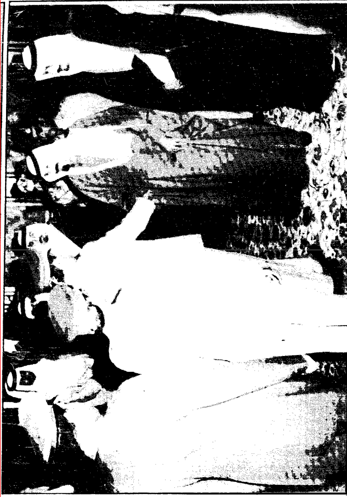
نائب خادم الحرمين الشريفين . يصالح كبار المواطنين من مدنيين وعسكريين أثناء مغادرته مطار الملك خالد متوجهًا إلى نجران