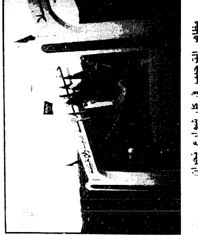
مظاهر الترحيب في كل شوارع نجران

سموه يفتتح مجمع المنشآت الرياضية والترفيهية إنشاء نجران يقيمون حفلا ترحيبيا على شرف سموه أمير نجران : الزياره تجسيد الحب والاحترام والتمثيل للبشر.. الجنوبي : الشاعر الفياضة تجاوز كل مظاهر التمسك بالسياسي مسيري : اللقاء يمسك حرم قاداتنا على تحقيق امانينا مواطن: قطننا ١٥٠ كيلو مترا لنشارك في هذا اللقاء