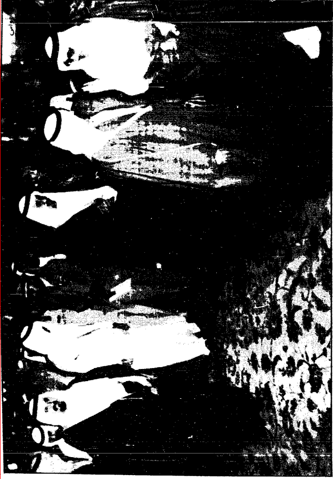
نائب خادم الحرمين الشريفين لدى مغادرته مطار الملك خالد متوجهًا إلى نجران