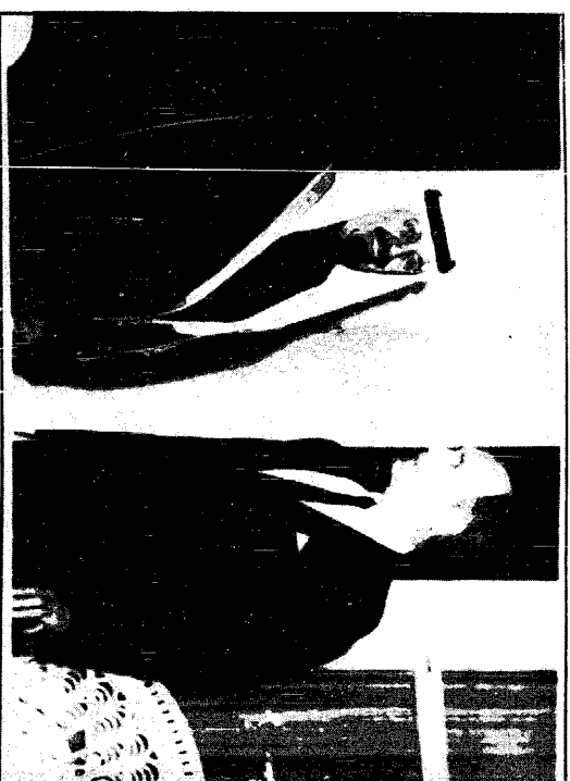
سموه الملكة مبرات في الزيارة مع نقيب الرئيس جورج بوش الذي عبر عن تقديره لاهتمام كبيرين سموه