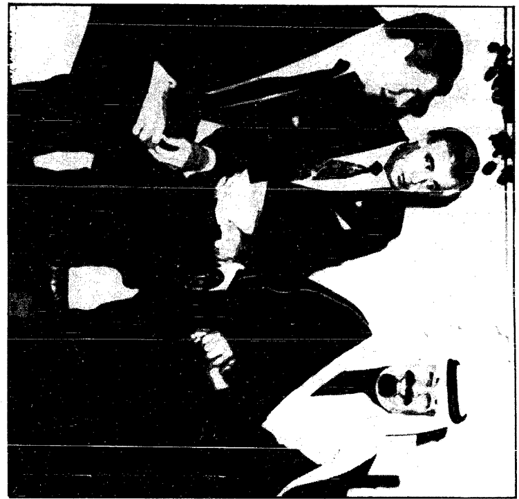
لقاءات الأمانة بتميزت منحه سمو الأمير عبدالله مع الرئيس الأمريكي رونالد ريجان