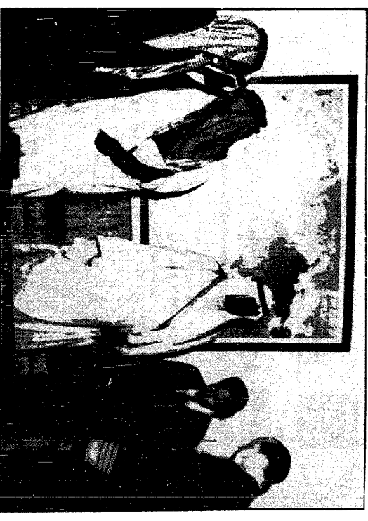
سمو الأمير عبدالله في زيارته لوزارة السياحة الأمريكية