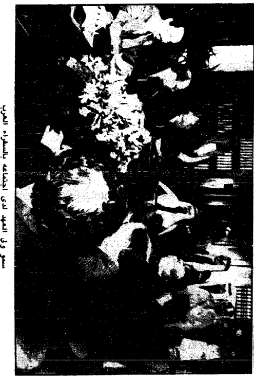
سمو ولي العهد لدى اجتماعه بمشاهير المهنة