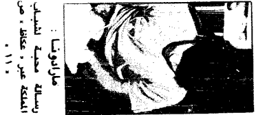
في هذا المكان... رسالة من مدينة فلسطين المحتلة عبر «عقلم» ص ١١٠

ترتيب عالي بنتائج قمة عمان عمان - عواصم - وكالات تارات أمس تودت العمل العجلة الأردنية لتتابع القمة العربية الثالثة - ويتبعها الطبع الرابع - مساء اليوم في فندق عمان بوسط مدينة عمان. وتعد هذه القمة العربية الثالثة من نوعها في تاريخ الأردن على مدار ١٠٠ سنة، حيث شهدت القمة العربية الأولى في عمان بوسط مدينة عمان في ١٩٥٨م، والتي كانت بمثابة نقطة انطلاق للعلاقات العربية العربية. وتعد هذه القمة العربية الثالثة من نوعها في تاريخ الأردن على مدار ١٠٠ سنة، حيث شهدت القمة العربية الأولى في عمان بوسط مدينة عمان في ١٩٥٨م، والتي كانت بمثابة نقطة انطلاق للعلاقات العربية العربية.