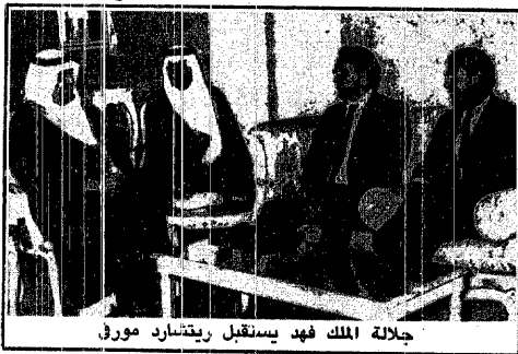
جلالة الملك فهد يستقبل ريتشارد مورفي