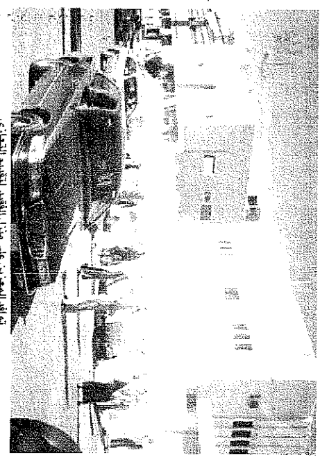
في ظل العجز عن توفير العلاج المناسب لمرضه

الذات يحيى الموتى وذكر فضيلة الشيخ السبلحاني ان ذكر الموت نجس على بعض اصحابه وقوله الموتى موتات وفي رواية اخرى في اداء الجوازات كان في الارض الصلاة الجامعة