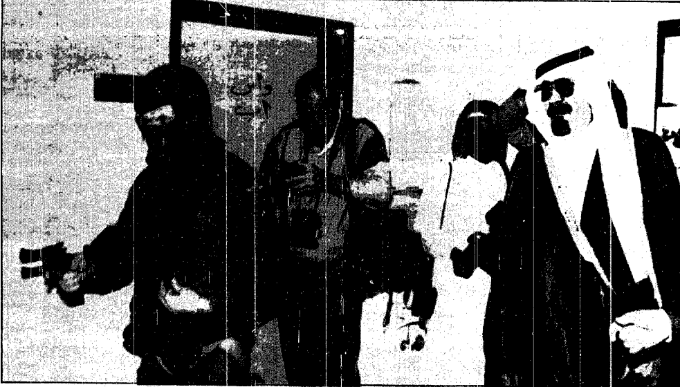
سمو ولي العهد يتابع تدريبات لاحدي وحدات الجيش النمساوي وهي تقوم بحدى المهم الخاصة