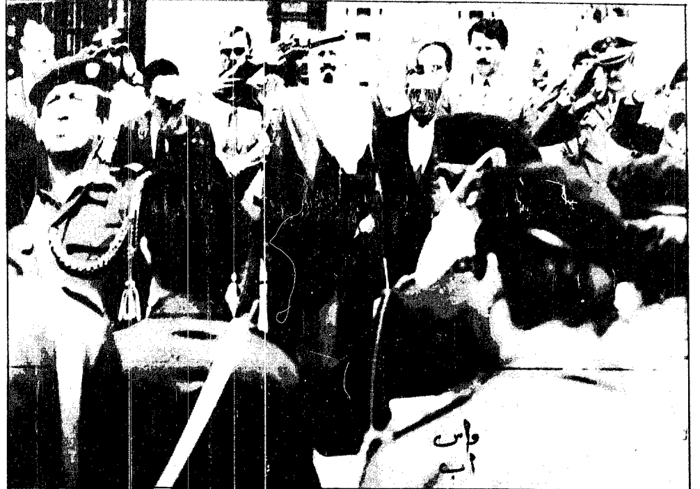
سمو الامير عبدالله يشاهد عرضا لاحدي وحدات الجيش النمساوي بجنوب النمسا