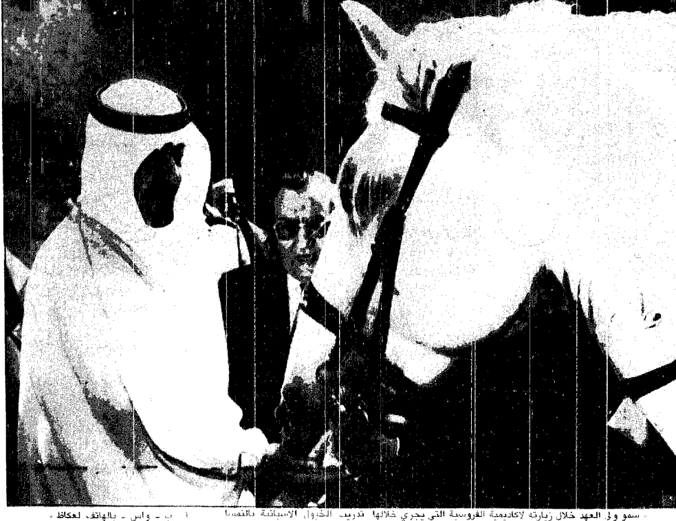
سمو ولي العهد خلال زيارته لأكاديمية الغروسية التي يجري خلالها تدريب الخيول الإسبانية بالنمسا