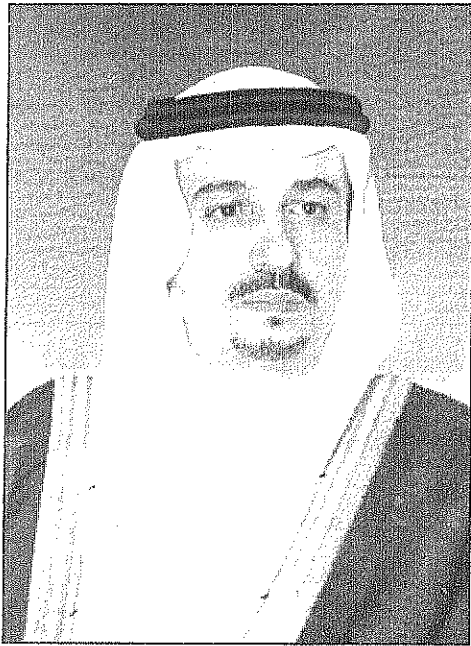
الأمير فيصل بن بندر