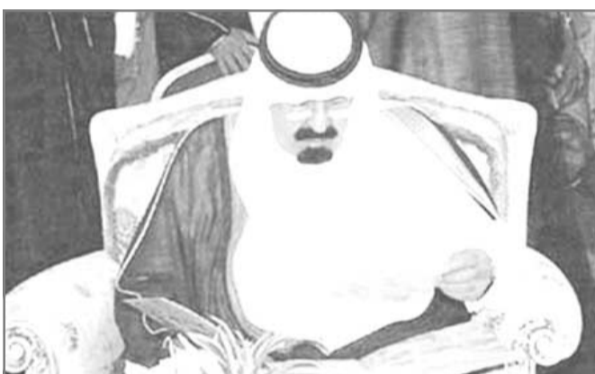
نائب الملك لدى افتتاح مشروع الخرن الاستراتيجي بجدة