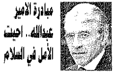
ترجمة: محمد بشير جابري