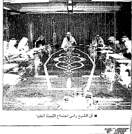
الشيخ راس اجتماع اللجنة العليا

مسلم الشمري (الرياض) راس سعالي وزير الشؤون الاسلامية والاوقاف والدعوة والارشاد الشيخ صالح بن عبدالعزيز بن محمد آل الشيخ بمكتبه بالوزارة امس الاجتماع الثاني للجنة العليا لاعمال الوزارة في حج هذا العام وذلك بحضور اعضاء اللجنة. ونوه آل الشيخ في بداية الاجتماع بدعم وجهود خادم الحرمين الشريفين سمو ولي عهد الامين وسمو النائب العظيم الله في خدمة ضيوف الرحمن خلال موسم الحج من كل عام كما ثن جهد صاحب السمو الملكي الامير نايف بن عبدالعزيز وزير الداخلية رئيس لجنة الحج العليا وصاحب السمو الملكي الامير عبدالعزیز بن عبدالعزيز امير منطقة مكة المكرمة