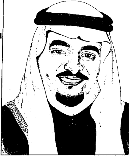
جلالة الملك فهد بن عبد العزيز القدي