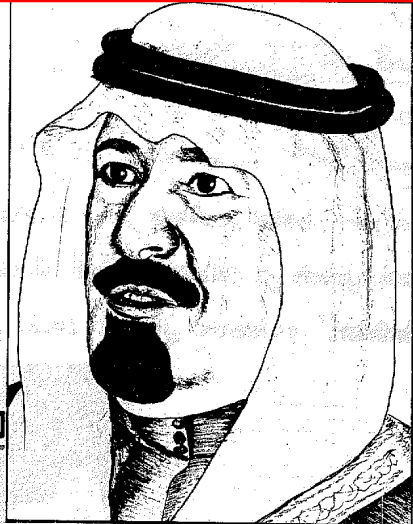
الأمير عبد الله بن عبد العزيز