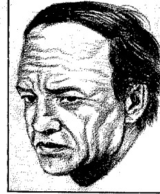
انجفار كارلسون رئيس وزراء السويد