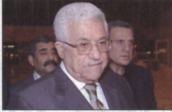
الرئيس عباس يتحدث للصحفيين في الرياض أمس.

عدواناً شرساً ذهب ضحيته مئات الأرواح البريئة وقال مازال هذا العدوان مستمرا ولا نعتقد أن هناك من الأسباب ما يجعل (إسرائيل) تقوم بمثل هذا العمل البشع على الشعب الفلسطيني. وأكد فخامة الرئيس الفلسطيني ضرورة وقف هذا الهجوم الإسرائيلي وحماية أرواح الإبرياء وما يتبقى من بنية تحتية في المناطق الفلسطينية. وقال التهديد بالنسبة لنا أمر في غاية الأهمية وغاية الضرورة لا يستطيع شعبنا أن يتحمل كل هذا.. عدوان وحصار في أن معا نحن نسعى دائما إلى تثبيت التهديد وكنا نضغط على (إسرائيل) وأخوتنا في مصر قاموا بجهود جبارة لتثبيت التهديد أكثر من مرة وكما تعلمون أنهم هم الذين وضعوا أسس هذه التهديد.