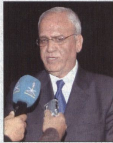
عريقات يتحدث للصحفيين.

العربية السعودية. وقال معاليه «إن سيادة الرئيس أبي مازن والشعب الفلسطيني عاجزون عن تقديم الشكر والعرفان لهذه اللقطة الكريمة من خادم الحرمين الشريفين والإشقاء في المملكة العربية السعودية في ظرفنا العصيب والكثيب وهذا الانقسام الفلسطيني الحاصل الذي يجب أن نجد له حلا.. ونوه معاليه بجهود خادم الحرمين الشريفين التي أقرت عن اتفاق مكة المكرمة بين الفلسطينيين وقال «لأسف إن لم تساعد أنفسنا نحن الفلسطينيين فلن يتمكن من مساعدتنا أحد.. ووصف عريقات ما شهده قطاع غزة من أحداث اليوم بأنه يوم دمار أسود ويوم جريمة حرب ترتكبها (إسرائيل) مؤكدا وجوب أن يدرك الفلسطينيون أن قطاع غزة تماما كالضفة والقدس مناطق محتلة وأن التحدي الرئيس هو الاحتلال الإسرائيلي. ودعا باسم الرئيس محمود عباس كل فصائل العمل السياسي الفلسطيني للتعاون مع الجهد الذي تبذره مصر في مجال الحوار لإنهاء هذا الجرح والانقسام ولتوحيد الجهود مشيراً إلى أن الوضع أصبح محزنا ومولما ومخجلا أن يكون حال القضية الفلسطينية قد وصل لهذا الحال.