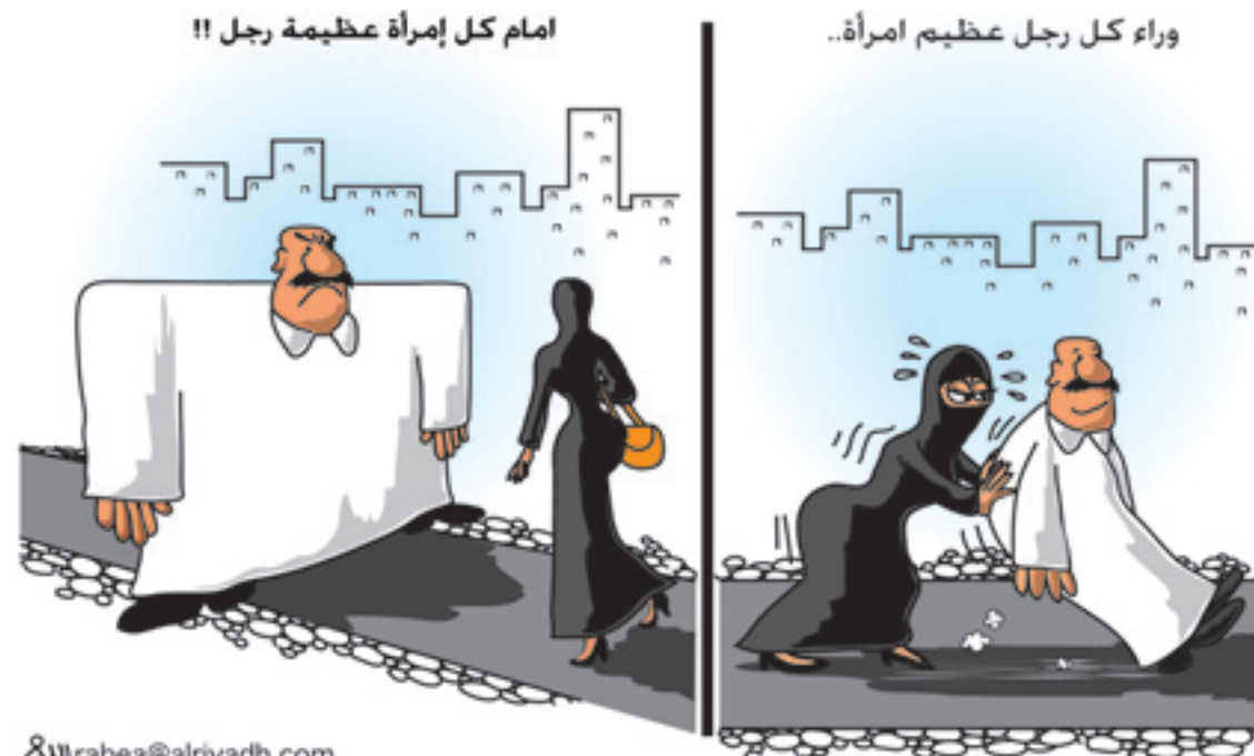
رءاء كل رجل عظيم امرأة.. امام كل إمرة عظيمة رجل !!

الرياض - عبدالسلام البلوي: يناقش مجلس الشورى الأحد المقبل مقترح إنشاء جمعية الملك فهد للسلامة ومشروع اللائحة التنظيمية للجنة الوطنية لسلامة المرور، وكذا إنشاء شركة مساهمة للفحص الدوري ضمن الدراسة التي قدمته اللجنة الأمنية لضرورة إيجاد الحلول العلمية السريعة لظاهرة ارتفاع معدلات الإصابات والوفيات نتيجة حوادث السيارات. من جانبها شرعت لجنة الإدارة والموارد البشرية