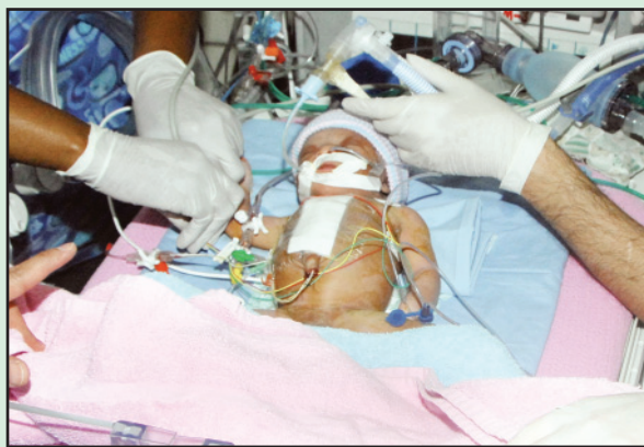
الطفلة الصومالية في غرفة العلاج المركز الخديج

الرياض - محمد الحيدري: وجهه خادمة الحرمين الشريفين الملك عبد الله بن عبدالعزيز (حفظه الله) معالي وزير الصحة رئيس الفريق الجراحي والطبي لعمليات الفصل السيامية الدكتور عبدالله الربيعية بدراسة التقارير الطبية لتوائم سيامي من (بنجلاديش) والصين) ومعرفة مدى إمكانية علاجهم في مدينة الملك عبد العزيز الطبية للحرس الوطني بالرياض وذلك اثر توجيه اسرهم نداءات واستغاثة عاجلة في البحث عن العلاج. وقال الربيعية: «طلبنا تقارير مفصلة للحالتين لدراستها والتوصل إلى قرار مع زملائي أعضاء الفريق الطبي والجراحي في إمكانية عملية الفصل ورفع