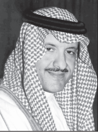
الأمير سلطان بن سلمان

السياحي في معظم دول العالم، مع ما تمتلكه المملكة من مقومات كبيرة في مجالات التراث المادي وغير المادي وأنماط الحياة التي كان يحياها أهل هذه البلاد.