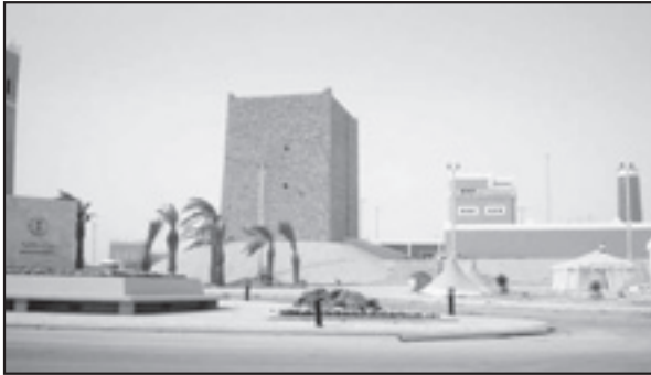
جناح منطقة عسير

أكثر المطالب التي ينادي بها المواطنون والزوار للمهرجان كل عام، حيث تمت الموافقة هذا العام بتخصيص ثلاثة أيام للعوائل بدلا من ايام النساء المتعارف عليها منذ انطلاق المهرجان ووجد هذا المقترح عناية خاصة من اللجنة العليا للمهرجان التي تعمل جاهدة على تطوير المهرجان، وزيادة عدد الزائرين، وتهيئة الفرصة لأسرة السعودية للاطلاع عن قرب على تراث الأباة والأجداد.