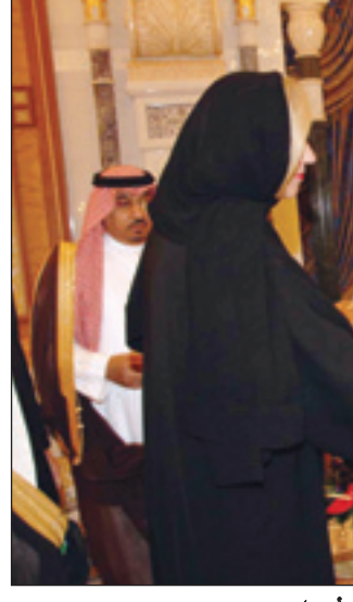
خادم الحرمين لدى استقباله سيجريد كاج..

ترحبه عبر خادم الحرمين الشريفين عن محبة المنظمة لمنظمة اليونيسيف