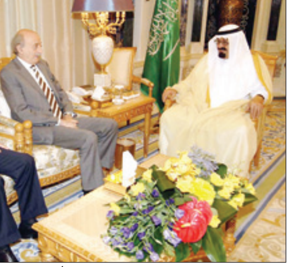
خادم الحرمين مستقبلاً جنبلاط