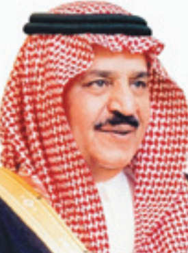
الأمير نايف بن عبدالعزيز

■ بتوجيهات من صاحب السمو الملكي الأمير نايف بن عبدالعزيز نائب رئيس مجلس الوزراء وزير الداخلية والمشرف العام على اللجنة السعودية لإغاثة الشعب الأفغاني، تقيم اللجنة حفل توقيع مذكرة تفاهم بين اللجنة السعودية لإغاثة الشعب الأفغاني ومنظمة الأمم المتحدة للطفولة (اليونيسيف) والتي تهدف لتقديم دعم للمنظمة بمبلغ مليون دولار لمشروع القضاء على شلل الأطفال في الأفغاني المهندس فهد بن حمد المبارك.