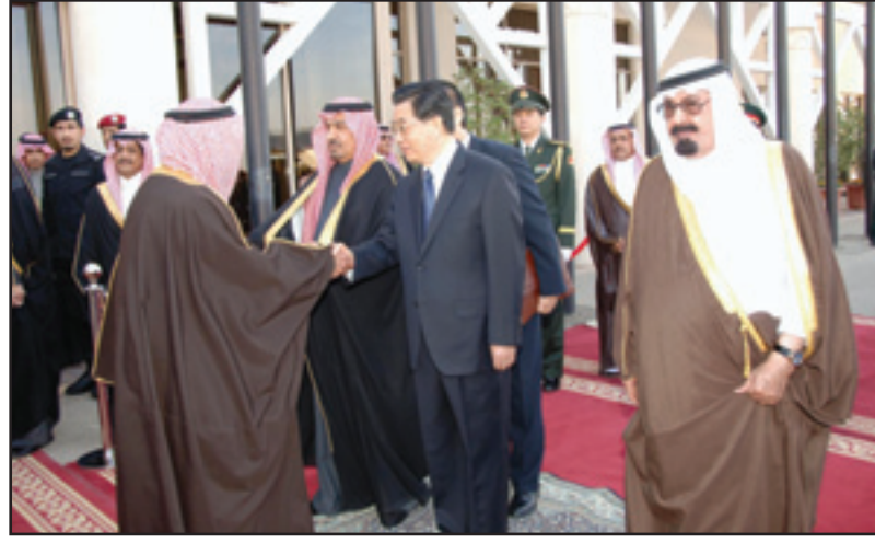
خادم الحرمين وإلى جواره الرئيس الصيني يصفاح مستقبليه في المطار (و.أ.س)