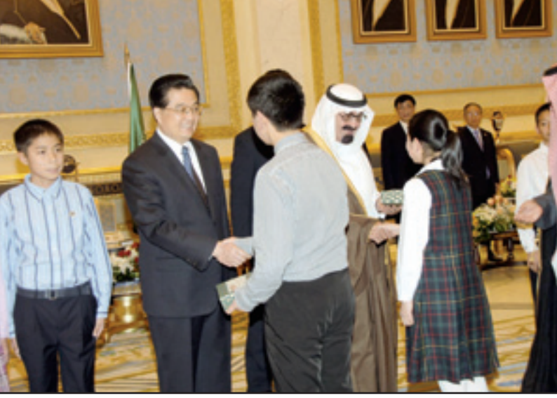
اطفال منطلة سيثوان يصفاحون خادم الحرمين والرئيس الصيني

أيدته الله على ما قدمته المملكة من مساعدات إنسانية لمطلقهم إثر الزلزال المدمر الذي ضربها، كما تشرفوا باستلام هدايا تذكارية من خادم الحرمين الشريفين. وبعد استراحة قصيرة في صالة التشریفات غادر فخامة الرئيس هو جيتناو في موكب رسمي إلى المقر المعد لإقامة فخامته. ويضم الوفد الرسمي المرافق لفخامة رئيس جمهورية الصين الشعبية كلاً من معالي عضو أمانة سر اللجنة المركزية للشؤون العربية والسياسية للجنة وانغ هونينغ ومعالي مستشار الدولة داي بينغقوه ومعالي وزير الخارجية وانغ جيتشي ومعالي رئيس لجنة الدولة للتنمية والإصلاح تشانغ بينغ ومعالي وزير التجارة تشن ديمنغ ومدير مكتب فخامة الرئيس الصيني تشن شيجيوي ومساعد وزير الخارجية تشاي جيون. حفل عشاء واستقبال خادم الحرمين الشريفين.