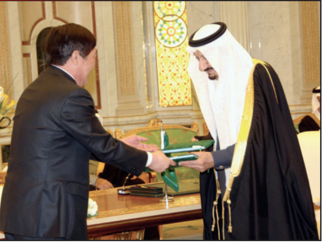
توقيع الاتفاقيات بحضور خادم الحرمين وفخامة الرئيس الصيني

الرياض - و.أ.س: بحضور خادم الحرمين الشريفين الملك عبدالله بن عبدالعزيز آل سعود وفخامة الرئيس هو جيتناو رئيس جمهورية الصين الشعبية جرى مساء أمس في قصر خادم الحرمين الشريفين بالرياض التوقيع على عقد وعد من مذكرات التفاهم بين البلدين، حيث تم التوقيع على عقد ترسية مشروع قطار المشاعر المقدسة من عرقات إلى مرزلفة فنى على الشركة الصينية لإنشاء السكك الحديدية وقعه عن الجانب السعودي صاحب السمو الملكي الأمير متعب بن عبدالعزيز وزير الشؤون البلدية والقروية رئيس هيئة تطوير مكة المكرمة والمدينة المنورة والمشاعر المقدسة، ومن الجانب الصيني رئيس الشركة الصينية لإنشاء السكك الحديدية جين يوتشينغ. وتبلغ التكلفة الإجمالية للمشروع ستة مليارات وستمائة وخمسين مليون ريال وصدرة تنفيذها سنتان من تاريخ الترسية وسوف يتم تشغيل ما نسبته ٣٥ بالمائة من الطاقة الاستيعابية في موسم حج ١٤٣١هـ وسيعمل القطار بكامل طاقته الاستيعابية في موسم حج عام ١٤٣٣هـ إن شاء الله. كما جرى التوقيع على مذكرة تفاهم ملحقه ببروتوكول التعاون بين حكومة المملكة العربية السعودية وحكومة جمهورية الصين الشعبية في قطاعات البترول والغاز والمعادن وقها عن الجانب السعودي صاحب السمو الملكي الأمير عبدالعزيز بن سلمان بن عبدالعزيز مساعد وزير البترول والثروة المعدنية، ومن الجانب الصيني معالي رئيس هيئة الدولة للطاقة تشانغ توباو. وجرى التوقيع على مشروع مذكرة التفاهم في مجال الحجر الصحي عند دخول الأفراد المنافذ الحدودية وخروجهم منها بين وزارة الصحة في المملكة العربية السعودية والإدارة العامة لمراقبة وفحص الجودة والحجر الصحي بجمهورية الصين الشعبية وقها عن الجانب السعودي معالي وزير الصحة الدكتور حمد بن عبدالله المانع ومن