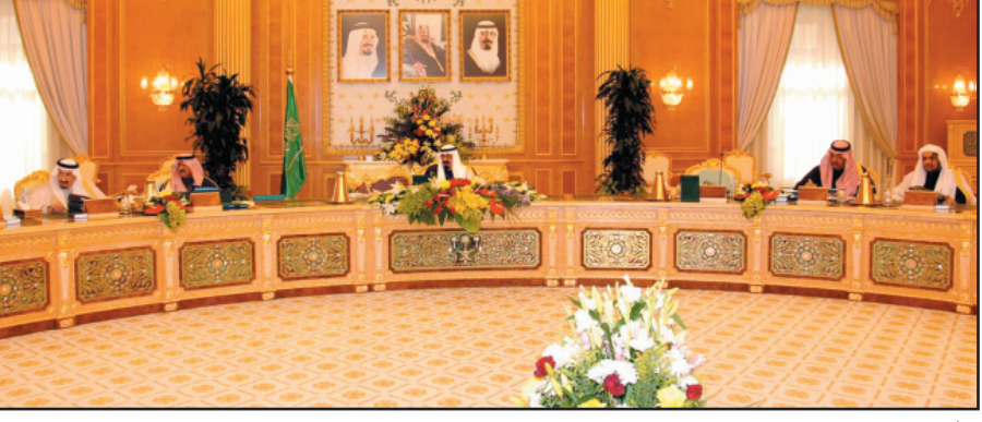
خادم الحرمين مترأساً جلسة مجلس الوزراء

خووجه أن المجلس وأصل بعد ذلك مناقشة جدول أعماله واتخذ من القرارات ما يلي: أولاً: قرر مجلس الوزراء الموافقة على تعديل الفقرة (١) من المادة (الثالثة) من الاتفاق الجوي بين حكومة المملكة العربية السعودية وحكومة جمهورية إندونيسيا للنقل الجوي المنتظم الموافق عليه بالرسوم الملكي رقم (٥٨/م) وتاريخ ١٤٠٩/١١/٨هـ لتصبح بالنص الآتي: ١ - يحق لكل طرف متعاقد أن يعين كتاية للطرف المتعاقد الأخر خطوطاً جوية واحدة أو أكثر لغرض تشغيل الخدمات المتفق عليها. وقد أعد مرسوم ملكي بذلك. ثانياً: بعد الإطلاع على ما رفعته الهيئة العامة للسياحة والآثار بشأن دراسة موضوع المواقع الأثرية ومواقع التراث العمراني التي يملكها مواطنون واقتراح حلول مناسبة لنزع ملكيتها وحل مشكلة تعويض اصحابها أقر مجلس الوزراء عدداً من الإجراءات التي وافقت عليها الهيئة العامة للسياحة والآثار من التصدي لهذا الموضوع من جمع جوانبه وفق ما ورد تفصيلاً في القرار. كما نص على قيام الهيئة