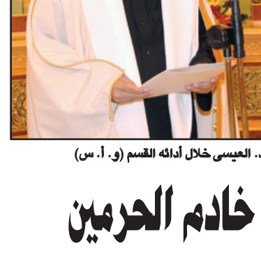
الأمير عبدالعزيز بن عياف

الرياض - (و.أ.س): وجه سمو أمين منطقة الرياض الدكتور عبدالعزيز بن محمد بن عياف الجهات المختصة في الأمانة بالإعداد للبدء في أقرب وقت ممكن في تنفيذ مشاريع جديدة تخصص لسفلية أهم الشوارع الرئيسية والضرورية لتسهيل إيصال المرافق العامة والخدمات المختلفة إلى هذه المخططات، وتمكين المواطنين من اعمار وأزدهارها. ويأتي هذا التوجيه في إطار البرنامج الذي بدأته أمانة منطقة الرياض في الأونة الأخيرة لتطوير مناطق المنح ومخططاتها في مختلف أنحاء مدينة الرياض، وتعزيز عوامل نموها وإزدهارها. ويأتي هذا التوجيه في إطار البرنامج الذي بدأته أمانة منطقة الرياض في الأونة الأخيرة لتطوير مناطق المنح ومخططاتها في مختلف أنحاء مدينة الرياض، وتعزيز عوامل نموها وإزدهارها. ويأتي هذا التوجيه في إطار البرنامج الذي بدأته أمانة منطقة الرياض في الأونة الأخيرة لتطوير مناطق المنح ومخططاتها في مختلف أنحاء مدينة الرياض، وتعزيز عوامل نموها وإزدهارها. ويأتي هذا التوجيه في إطار البرنامج الذي بدأته أمانة منطقة الرياض في الأونة الأخيرة لتطوير مناطق المنح ومخططاتها في مختلف أنحاء مدينة الرياض، وتعزيز عوامل نموها وإزدهارها.