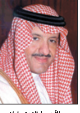
الأمير سلطان بن سلمان

الرياض - (الرياض): رفع صاحب السمو الملكي الأمير سلطان بن سلمان بن عبدالعزيز رئيس الهيئة العامة للآثار والسياحة ورئيس مؤسسة التراث أسماً أيات الشكر والعرفان إلى مقام خادم الحرمين الشريفين الملك عبدالله بن عبدالعزيز - حفظه الله - على رعايته ودعمه لل العناية بالتراث والمحافظة عليه، مشيراً إلى تكلفه في هذا الإطار بتكاليف إعادة ترميم مسجد الشافعي والمعاهد في جدة، مما يعد استمراراً لجهود - حفظه الله - في المحافظة على التراث الوطني، والتي تمثل نموذجاً عالمياً يستحق الاقتداء، اعتداً وافخراً يبارئنا الحضاري. كما أشاد سموه بدعم صاحب السمو الملكي الأمير سلطان بن عبدالعزيز ولي العهد نائب رئيس مجلس الوزراء وزير الدفاع والطيران والمفتش العام - حفظه الله - لرعايته انطلاقة البرنامج الوطني للمساجد العتيقة، منوها بما يجده هذا البرنامج من دعم كبير من سموه. جاء ذلك بمناسبة افتتاح صاحب السمو الأمير بدر بن محمد بن جلوي آل سعود محافظ الأحساء، مسجد الجبري بالهفوف؛ ليصبح بذلك أول مسجد يتم ترميمه في إطار البرنامج الوطني للعناية بالمساجد العتيقة، الذي تتبناه مؤسسة التراث بإشراف وزارة الشؤون الإسلامية والأوقاف والدعوة والإرشاد. وأوضح الأمير سلطان بن سلمان أن هذا البرنامج يهدف إلى الاهتمام بالمساجد ذات الخصائص العمرانية المحلية في مناطق المملكة المختلفة، التي تحتاج إلى التأهيل، وإعادة الأعمار، وفق المعايير العالمية للمحافظة على التراث العمراني. وأضاف سمو رئيس مؤسسة التراث أن من خلال