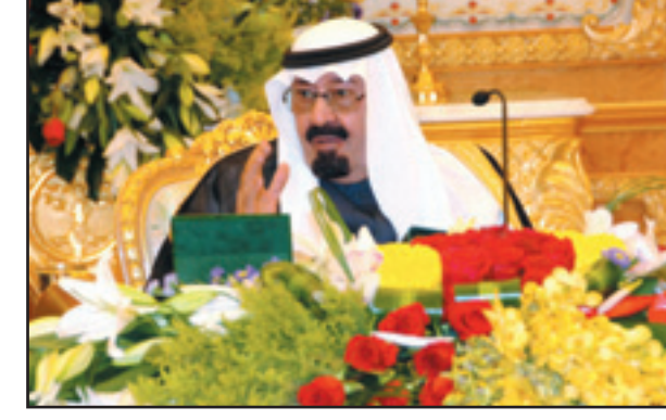
خادم الحرمين مترأساً جلسة مجلس الوزراء (واس)

الحكومة اللبنانية السابق رفيق الحريري ما يحقق العدالة التي يتطلع إليها الجميع. وأوضح معالي الدكتور عبدالعزيز بن محيي الدين خوجة أن مجلس الوزراء دان خطط سلطات الاحتلال الإسرائيلي الهادفة إلى ترحيل ١٥٠٠ مواطن فلسطيني في حي البستان بمدينة القدس من منازلهم. وعبر عن رفض المملكة