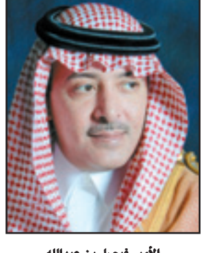
الأمير فيصل بن عبدالله

الرياض - (و.أ.س): تشرف بإهداء القسم بين يدي خادم الحرمين الشريفين الملك عبدالله بن عبدالعزيز آل سعود حفظه الله في قصر اليمامة أمس الشيخ الدكتور محمد بن عبدالكريم العيسى بمناسبة صدور الأمر الملكي الكريم بتعيينه وزيراً للعدل قائلاً: «أقسم بالله العظيم أن أكون مخلصاً لديني، ثم للملكي وبيلاي، وأن لا أبوح بسر من أسرار الدولة، وأن أحافظ على مصالحها وأنظمتها، وأن أؤدي أعمالي بالصدق والأمانة والإخلاص». عقب ذلك تشرف بالسلم على خادم الحرمين الشريفين. وقد أعرب الملك المفدى عن تهنئته له داعياً الله عز وجل أن يوفقه لخدمة دينه ووطنه. من جهته أعرب وزير العدل عن شكره