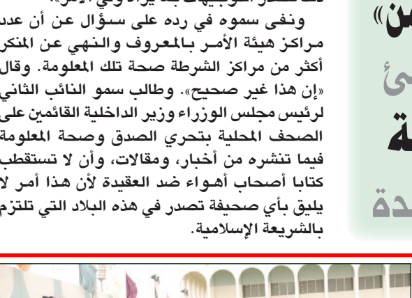
سمو الفريق أول ركن متعب بن عبد الله يسلم الشهادات للخريجين

التقدير للمتفوقين. عقب ذلك قدم طلبة الكلية استعراضاً عسكرياً حاز على إعجاب الحضور. ثم عزف السلام الملكي إيذاناً بانتهاء الحفل. حضر الحفل صاحب السمو الملكي الامير نايف بن سعود بن عبدالعزيز وصاحب السمو الملكي الامير ممدوح بن عبد الرحمن بن سعود وصاحب السمو الامير خالد بن عبدالعزيز بن عياف آل مقرن وكيل الحرس الوطني لشؤون الفوج ورؤساء الهيئات العسكرية وقادة الوحدات العسكرية وعدد من مسؤولي الحرس الوطني من مدنيين وعسكريين.