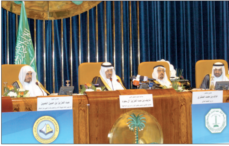
سمو النائب الثاني يمشي مشروع الخطة الاستراتيجية