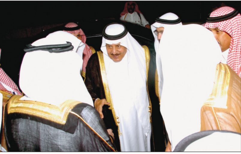
الأمير نايف خلال وصوله مقر الحفل

تهنئة لفخامة الرئيس جيمس أليكس ميشيل رئيس جمهورية سيشل بمناسبة ذكرى يوم الاستقلال لبلاد. وعبر سمو ولي العهد عن أبلغ التهاني وأطيب التمنيات بموفور الصحة والسعادة لفخامته ولشعب سيشل الصديق المزيد من التقدم والازدهار.