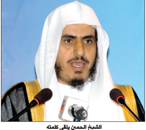
الشيخ الحمين يلقي كلمته

ورأى سموه أن الاستهداف الذي تواجهه المملكة في تهريب المخدرات أصبح عبئاً كبيراً على رجال الجمارك والأمن لأن الأساليب التي يتبعها المهربون أصبحت معقدة وتستلزم تفتيشاً دقيقاً. وأشار سموه إلى أن هناك تضخماً من وسائل الإعلام لبعض الأخطاء في أعمال الهيئة، وقال سموه «ليس هناك جهة .. أو شخص سليم لا يخطئ الكمال لله لكن هناك تضخم في بعض وسائل الإعلام سواء كانت محلية أو خارجية لبعض الأخطاء التي تحصل فإذا كان الإنسان سيركز على البحث عن السلبيات سيجدتها وإذا كان يركز على الإيجابيات سيجدتها لكن يجب أن يكون عادلاً في