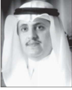
د. محمد الصالح

بمناسبة الموافقة السامية على قرار مجلس التعليم العالي بإنشاء أربع جامعات جديدة بالمملكة عبر الأمين العام لمجلس التعليم العالي الدكتور محمد بن عبدالعزيز الصالح عن سعاداته بأضافة أربع جامعات علمية جديدة إلى العشرين جامعة الأخرى، ومضيفاً بأن خلال سنوات قليلة قد ارتفع عدد الجامعات الحكومية وعشرين جامعة منتشرة في مختلف مناطق ومحافظات المملكة، ويأتي ذلك تنفيذاً لتوجيهات خادم الحرمين الشريفين رئيس مجلس التعليم العالي بافتتاح المؤسسات التعليمية في مختلف المحافظات بالمملكة. وأضاف الدكتور الصالح بأن من أهم المبررات التي دعت مجلس التعليم العالي لإنشاء جامعة الخرج وشقراء والجمعة ما تواجهها جامعة الملك سعود من تحديات قد تعوق مسيرة التطوير والتحديث فيها بسبب عوامل كميّة،