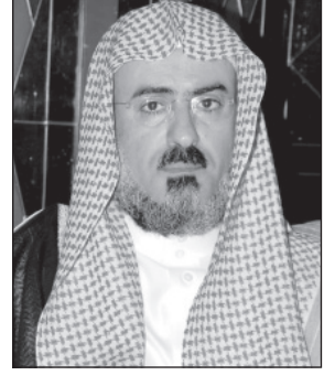
د. سليمان أبا الخيل

الرياض/ علي المنيع أكد مدير جامعة الإمام محمد بن سعود الإسلامية الأستاذ الدكتور سليمان أبا الخيل أن موافقة خادم الحرمين الشريفين على قرار إنشاء أربع جامعات في كل من الدمام والخرج والجمعة وشقراء يأتي تجسيداً لاهتمامه الكريم واهتمام سمو ولي عهده الأمين، وسمو النائب الثاني حفظهم الله بمسيرة التعليم في هذا الوطن وازدهارها، وتسخير الإمكانيات لتطويرها بما يساعد على إعداد جيل مؤهل يخدم هذا الوطن في شتى المجالات. وبنارك لوطننا العالي بولاء أمرنا الذين يبذلون جهودهم ويعملون على إيجاد كل الوسائل والأساليب الممكنة من أجل رقي هذه البلاد وأبنائها ومساهمتهم بشكل فاعل في بناء الوطن بشكل متميز يستجيب كل وسائل التطور والتحديث والنماء مع الثبات على المبادئ والأسس التي قامت عليها هذه البلاد المباركة حتى أصبحت بلداناً في هذا العهد الزاهر تجمع بين الأصالة والمعاصرة وتخدم الإنسانية جميعاً في مشارق الأرض ومغاربها عبر ما يقوم به خادم الحرمين