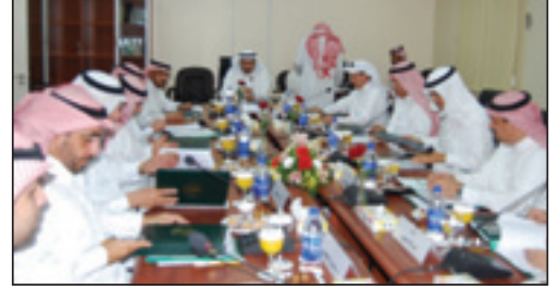
د. الربيعة مترئساً مجلس الخدمات الصحية