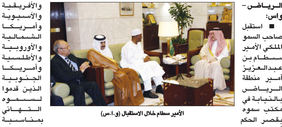
الأمير سطاتم خلال الاستقبال

الرياض - واس: استقبل صاحب السمو الملكي الأمير سطاتم بن عبدالعزيز أمير منطقة الرياض بالنيابة في مكتب سموه بقصر الحكم أمس عمداء السلك الدبلوماسي المعتمدين لدى المملكة بقدومهم عميد السلك الدبلوماسي مؤكدا أهمية المملكة سفيرة جمهورية بوركينا فاسو السفير عمر داياوارا إرفاقه عمداء المجموعات العربية