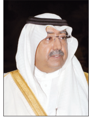
الأمير فيصل بن عبدالله بن محمد

الرياض-واس وجه صاحب السمو الأمير فيصل بن عبدالله بن محمد آل سعود وزير التربية والتعليم كافة قطاعات الوزارة ومديري التربية والتعليم في المناطق والمحافظات ومديري ومديرات المدارس، باتخاذ كافة التدابير والإجراءات اللازمة لمواجهة الظروف المناخية المتوقعة خلال الأيام القادمة، بما يضمن سلامة الطلاب والطالبات والمعلمين والمعلمات، وأن تكون مبنية على معلومات دقيقة من خلال متابعة ما يصدر من تقارير وتحذيرات من الرئاسة العامة للأرصاد وحماية البيئة والمديرية العامة للدفاع المدني حول تلك المخاطر. جاء ذلك عقب اطلاع سموه على التقارير والتحذيرات الصادرة عن الرئاسة العامة للأرصاد وحماية البيئة والمديرية العامة للدفاع المدني بشأن التقلبات الجوية وحالة الطقس المتوقعة على المملكة خلال الأيام القادمة، وما قد ينتج عنها من أمطار غزيرة وسيل. وشدد على أهمية متابعة مديري إدارات التعليم والمدارس ما يصدر من إدارات المتابعة في الوزارة وتقارير وتحذيرات من الرئاسة العامة للأرصاد