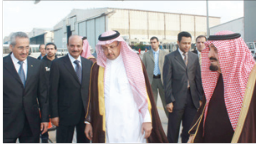
الأمير مشعل لدى مغادرته بيروت