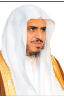
الشيخ عبدالعزيز الحمين

الرياض-عبدالله الحسيني ■ نوه الرئيس العام لهيئة الأمر بالمعروف والنهي عن المنكر الشيخ عبدالعزيز بن حمين الحمين بالدعم الكبير لولاة الأمر وعلى رأسهم خادم الحرمين الشريفين وولي عهده الأمين وسمو النائب الثاني لهيئة ومشاركتها أعمالها وقال الشيخ الحمين المشرف العام على أعمال الهيئة في الحج بمناسبة اختتام الهيئة لأعمالها: إن ولاة الأمر في هذه البلاد -أيدهم الله- حريصون كل الحرص على القيام بأمر الله تعالى ومساندة هذه الشعبية ودعم وتطويرها. ووصف الشيخ الحمين الأعمال الميدانية لهيئة في المشاعر المقدسة خلال موسم حج هذا العام ١٤٣٠م بالمتينة والتي كانت محل إشادة الحجاج وقبولهم وركزت على التعامل مع الأجهزة المشاركة ونشر المعروف والتوعية والتوجيه توج ذلك دراسة تقويمية لهذه المشاركة أسندت لعدد من أساتذة الجامعة لتطوير الأداء في الأوامر القادمة. والتقى إثر ذلك الرئيس العام بالأعضاء الميدانيين في ميادين عملهم لاستطلاع آرائهم ومقترحاتهم. وتم خلال اللقاء مناقشة الجهود والأعمال بشكل علمي وبناء عليه رفع معاليه شكره لله كما أشاد الرئيس العام لهيئة بالميدانيين على جهودهم في القيام بالأمر بالمعروف والنهي عن المنكر وتوجيه بعض الملتحقين وإرشادهم باللين والحكمة وأما ذلك أمراً فخر به ويتلج الصدر سماعه وهو مفتضح أوامر الشرع وتوجيهات ولاة الأمر مؤكداً أن خدمة الحجاج