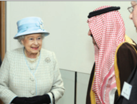
الملكة إليزابيث الثانية خلال افتتاحها للقاعة الأمير سلطان