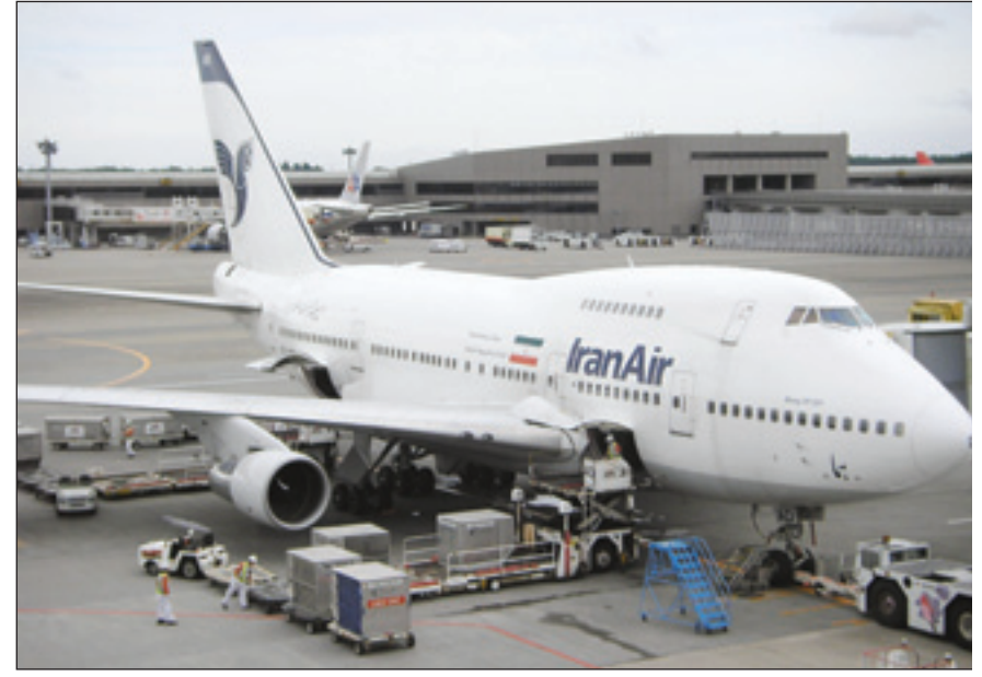
طائرة تابعة للخطوط الإيرانية