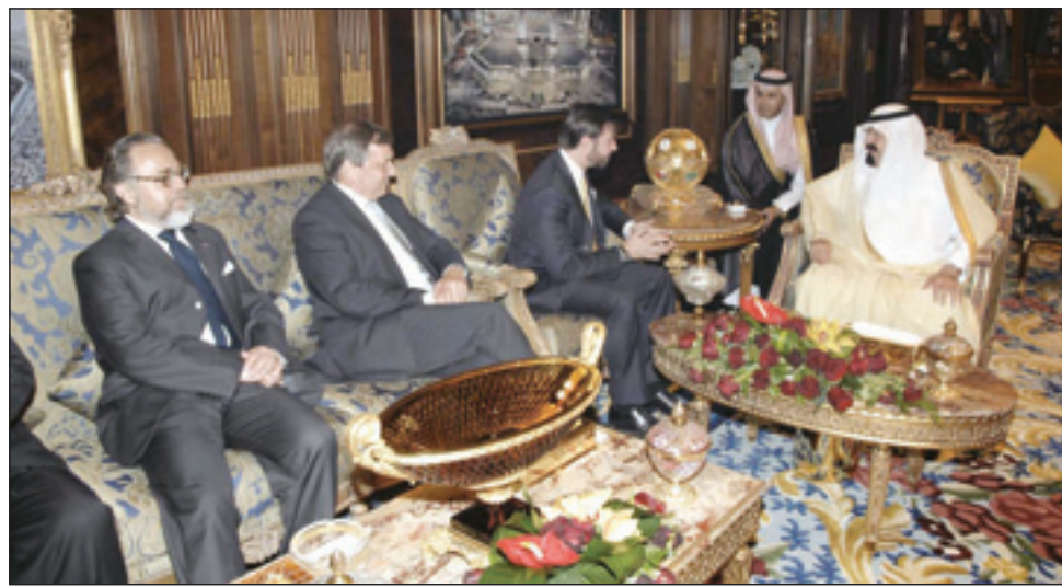
خادم الحرمين مستقبلاً ولي عهد لكسمبورج

كما بعث صاحب السمو الملكي الأمير سلطان بن عبدالعزيز آل سعود ولي العهد نائب رئيس مجلس الوزراء وزير الدفاع والطيران والمفتش العام برقية تهنئة لجلالة الملك هارالد الخامس ملك مملكة النرويج بمناسبة ذكرى يوم الدستور لبلاده. وأعرب سمو ولي العهد عن أبلغ التهاني، وأطيب التمنيات بموفقو الصحة والسعادة لجلالته، ولشعب النرويج الصديق المزيد من التقدم والازدهار.