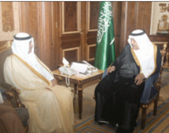
الأمير نايف مستقبلاً الأمير فيصل بن عبدالله

استقبل صاحب السمو الملكي الأمير نايف بن عبدالعزيز آل سعود النائب الثاني لرئيس مجلس الوزراء وزير الداخلية بمكتبه بوزارة الداخلية أمس صاحب السمو الملكي الأمير فيصل بن عبدالله بن عبدالعزيز آل سعود رئيس هيئة الهلال الأحمر السعودي الرئيس الفخري للجمعية السعودية الخيرية لمكافحة السرطان يرافقه أعضاء الجمعية السعودية الخيرية لمكافحة السرطان وعدد من مرضى السرطان الذين تعافوا بحمد الله من المرض. وقد رحب سموه بأعضاء الجمعية واستمع لشرح من رئيس مجلس إدارة الجمعية عن دور الجمعية التي تهدف إلى تقديم جميع الخدمات المساندة الاجتماعية والنفسية لمرضى السرطان، والمساهمة في دعم برامج النوعية الوقائية من السرطان والتثقيف الصحي للحد من انتشار الإصابة به، ودعم الخدمات الصحية وبرامج الكشف المبكر، ودعم وتشجيع البحوث العلمية للوقوف والتعرف على أسباب السرطان في المملكة، ودعم برامج تشخيص مرض السرطان وعلاجه. وعبر سموه عن شكره وتقديره للقائمين على الجمعية وعلى رأسهم سمو الأمير فيصل بن عبدالله على الجهود التي يبذلونها لمكافحة هذا المرض وسبل الوقاية منه، مبيناً أن العمل الخيري الذي تنتهجه الجمعية السعودية الخيرية لمكافحة السرطان أسهم في خدمة شريحة من المرضى الذين هم في أمس الحاجة للرعاية والدعم. وفي ختام الاستقبال سلم سمو النائب الثاني هدية تذكارية بهذه المناسبة تشرف بتقديرها سمو الأمير فيصل بن عبدالله بن عبدالعزيز وتقريراً عن إنجازات الجمعية متمنياً سموه للقائمين على أعمال الجمعية التوفيق والنجاح.