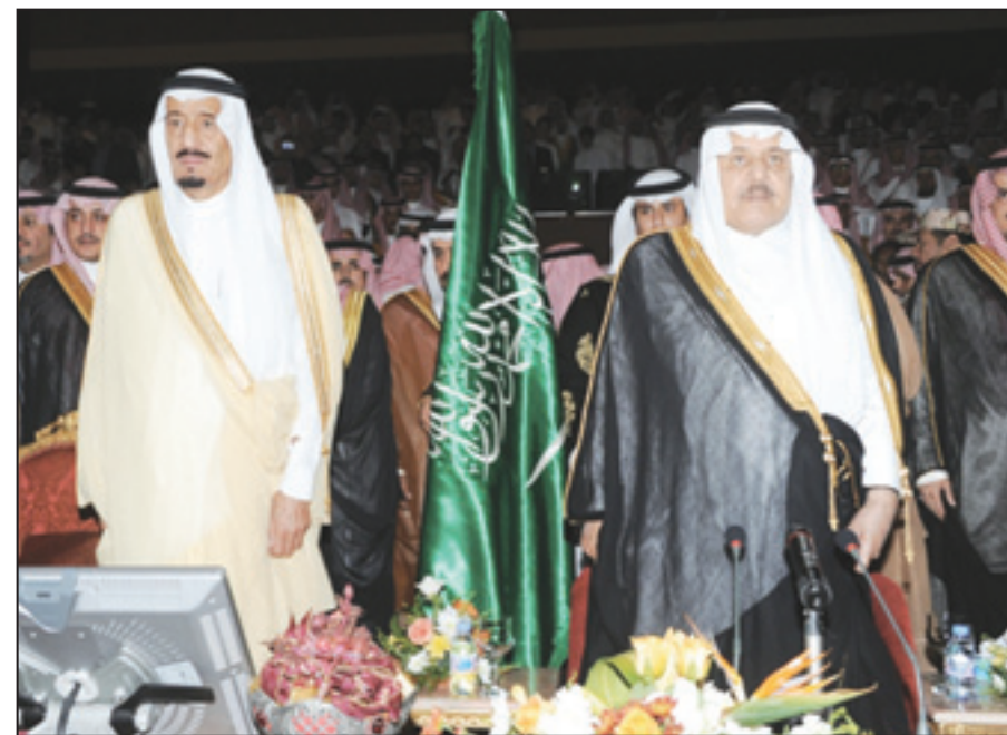
الأمير نايف والأمير سلمان أثناء السلام الملكي

حضر صاحب السمو الملكي الامير نايف بن عبدالعزيز النائب الثاني لرئيس مجلس الوزراء وزير الداخلية و صاحب السمو الملكي الامير سلمان بن عبدالعزيز امير منطقة الرياض الرئيس الفخري لمدارس الرياض احتفال مدارس الرياض للبنين والبنات بمناسبة مرور ٤٠ عاما على تأسيس المدارس مساء يوم امس الاحد بمقر المدارس بحي النموذجية بالرياض. وقد التقى صاحب السمو الملكي الامير نايف بن عبدالعزيز بهذه المناسبة كلمة قال فيها يسعدني و احي صاحب السمو الملكي الامير سلمان بن عبدالعزيز ان تشارككم في هذا الحفل المبارك بمرور ٤٠ سنة على تأسيس هذه المدارس الناجحة و الفاعلة لمجتمعنا و تخرج منها عدد كبير من ابناء الوطن وهم في افضل مستوى.