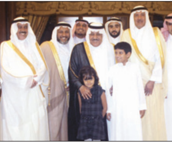
الأمير نايف في صورة جماعية مع اعضاء الجمعية