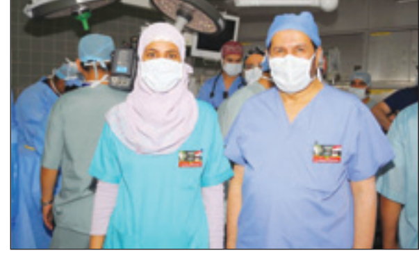
د. الربيعية مع الممرضة مصلحة الشريف داخل غرفة العمليات

الرياض - محمد الحيدر: وصف معالي وزير الصحة الدكتور عبدالله الربيعية رئيس الفريق الطبي والجراحي لعملية فصل التوأم السيامي العراقي زينب ورقية والتي تمت مؤخراً بمدينة الملك عبدالعزيز الطبية للحرس الوطني بالرياض مشاركة جهاز التمريض السعودي بالعملية بأنه مفخرة للوطن.