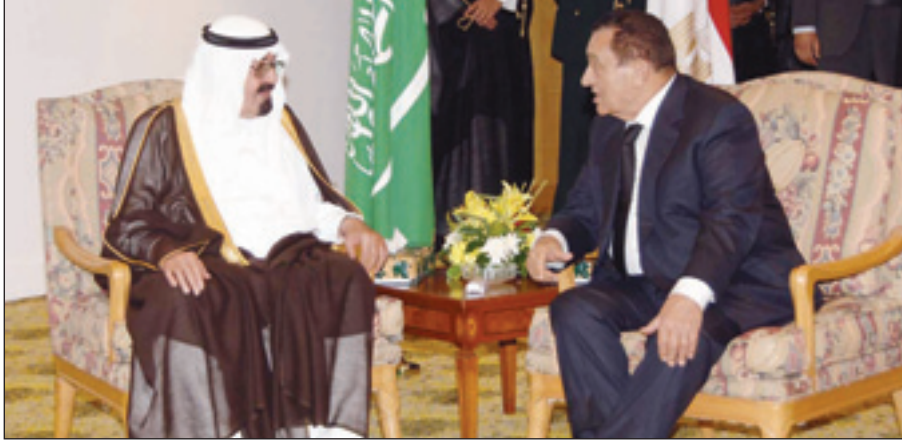
جانب من لقاء سابق جمع خادم الحرمين بالرئيس مبارك في شرم الشيخ

خلال الفترة الاخيرة والتي شملت كلا من الرئيس الجزائري وملك الاردن ورئيس السلطة الفلسطينية ورئيس وزراء لبنان. ويعد اللقاء المرتقب بين خادم