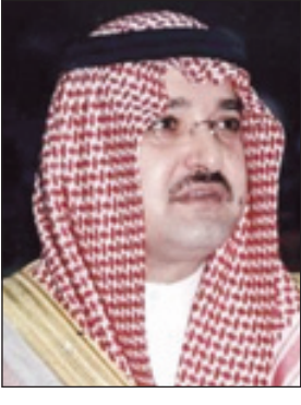
الأمير مشعل بن ماجد

جدة - ياسر الجاروشة عبر صاحب السمو الملكي الأمير مشعل بن ماجد أن خبر مغادرة خادم الحرمين الشريفين الملك عبدالله بن عبدالعزيز مستشفى بريسيتريان، مساء يوم الثلاثاء بعد أن من الله - جل جلاله - عليه بالصحة والعافية حفظة الله - هو يوم عيد أدخل البهجة والسرور على قلوب عموم أفراد الشعب. وقال محافظ جدة أسأل الله العلي القدير أن يديم عليه نعمة الصحة والعافية وأن يعود