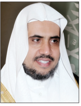
د. محمد العيسى

الرياض - اسامة الجمعان قال وزير العدل الدكتور محمد العيسى بمناسبة شفاء خادم الحرمين حمد الله تعالى على ما من به سبحانه من شفاء خادم الحرمين الشريفين، وتجاوزته للعراض الصحي، في جملة ما يقدره المولى سبحانه على كافة خلقه، وما يتفضل به على من يشاء من عباده بالعافية والشفاء والأجر والجزاء، فهو سبحانه من يقدر ويتفاني ويعافي، وقيم ويكافي. وأضاف وزير العدل بأن الأعراض الكونية التي يقدرها المولى على خلقه تحمل في طياتها الخير الكثير لمن آمن بالقدر والقضاء، فحقن الله عليه بنوال ما احتسب ونوى، ومن عاجل البشري في هذا ما لمس الجميع من فيض المشاعر نحو قائد المسيرة. يحفظه الله، وما لهجت به الدعوات المؤمنة برهبها، الواثقة برحمته وكرم بارئها، وهي من صدقت بحمد الله في حبها ومشاعرها نحو ولي أمرها حيث رفعت أكف الضراعة بأن يجعل لخادم الحرمين الشريفين بشفائه الذي لا يغادر سقماً، وأن يقر عين شعبه الوفي برويته، وقد أكرمه وأكرم شعبه وأتمه بعافيته والداً قائداً يرعى المسيرة في منظومة رجال الأمة. وأبان العيسى بأن خادم الحرمين الشريفين من رجال الأمة الكبار،