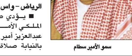
سمو الأمير سطاتم

الرياض - واس يؤدي صاحب السمو الملكي الأمير سطاتم بن عبدالعزيز أمير منطقة الرياض بالنيابة صلاة عيد الأضحى المبارك مع جموع المصلين بجامع الإمام تركي بن عبدالله، وعقب الصلاة يستقبل سموه في قصر الحكم المهنيين بعيده الأضحى المبارك.