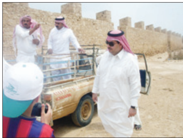
جانب من الزيارة