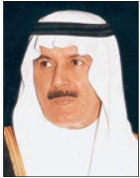
الأمير خالد بن عبدالله

٣. إعداد البحوث والدراسات ودعم الجهود المتعلقة بأغراض المؤسسة وتطويرها ونشرها، وبخاصة نشر معاني الوسطية والاعتدال والتسامح والسلام وتعزيز القيم الأمير خالد بن عبدالله