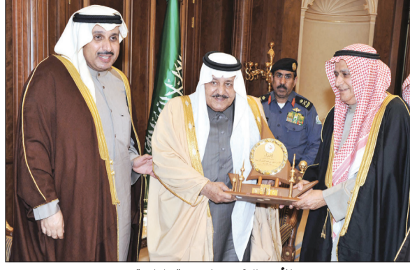
الأمير نايف يتسلم هدية تذكارية