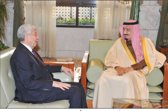
الأمير سلمان مستقبلاً السفير اللبناني