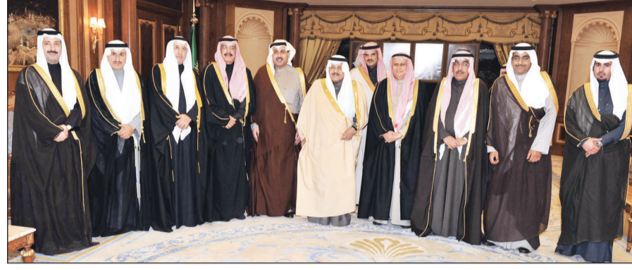
الأمير نايف لدى استقباله السفير الكويتي ويهبهاني والوفد الإعلامي

مدير عام الإدارة العامة للشؤون القانونية والتعاون الدولي الدكتور عبدالله بن فخرى الأنصاري. كما حضر الاستقبال وكيل وزارة الثقافة والإعلام لإعلام الخارجي الدكتور عبدالعزيز بن صالح بن سلمه.