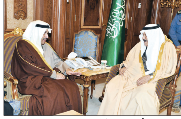
الأمير نايف مستقبلاً السفير الشيخ حمد الصباح