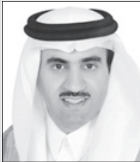
عبد السلام الراجحي

القرآن الكريم وإنشاء مجمع فقهي؛ كل ذلك يعكس الطابع المهم الذي تركز عليه هذه الدولة في العناية بالشرعية الإسلامية ومصايرها ووسائلها المباركة، وتؤكد أن المملكة العربية السعودية تحافظ على هوية هذا الوطن، وتؤكد ريادتها في تحكيم شريعة الإسلام؛ وهي بحمد الله تعد اليوم أبرز حصون دين الإسلام وقواعده الرئيسية، وتقوم عليها. ولله الحمد. دولة تلتزم بالإسلام، تأخذ به في عقيدتها، وتتمسك به في تشريعها، وهو عنوان رايثها: (لا إله إلا الله محمد رسول الله)، ويفخر ولايتها برعاية ودعم كل ما فيه عز ونصر وخدمة للدين وأهله من المؤسسات والهئات والمنظمات الرسمية والأهلية التي تسير وفق المنهج الإسلامي.