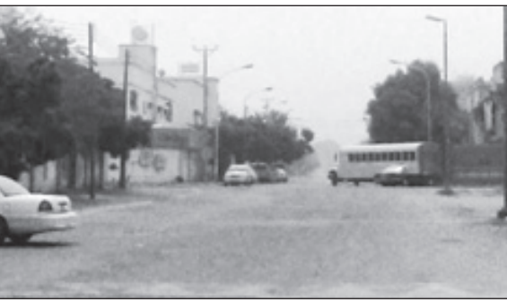
الأجواء الملبدة بالغبار استمرت ثلاثة أيام

الساعة الواحدة ظهراً إلى الساعة الثانية ظهراً . كما تم تحديد موعد مقابلة المراجعين والمرضى لمدراء المستشفيات بجميع مستشفيات المنطقة بشكل يومي ابتداء من الساعة الواحدة ظهراً إلى الساعة الرابعة عصراً . علماً بأن غرفة عمليات الطوارئ تستقبل البلاغات العاجلة على مدار الساعة على الهاتف رقم ٠٤٦٢٢٩٧٦ . متعين لجميع المرضى دوام الصحة والعافية وأن يوفق الله جميع المسؤولين لتقديم خدمات طبية ترتقي لتطلعاتهم.