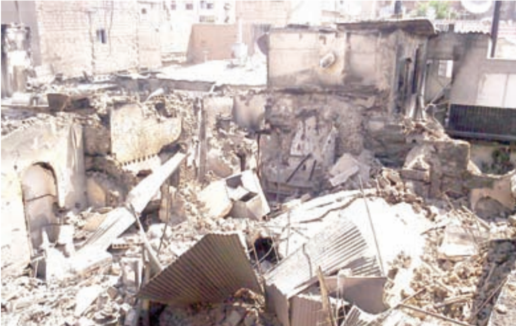
جانبا من آثار الدمار التي لحق بحي الميدان في دمشق جراء المعارك بين القوات النظامية والجيش الحر

على الأرض اقتحمت القوات النظامية السورية امس حيي القدم والعسالي في جنوب دمشق، بحسب المرصد السوري لحقوق الانسان.. وأشار إلى أن «المقاتلين المعارضين ما زالوا في حالة دفاع ولم يشنوا أي هجوم مضاد منذ أن بدأ الجيش النظامي هجومه لاستعادة السيطرة على دمشق قبل ثلاثة أيام». ولليوم الخامس على التوالي، تستمر الاشتباكات العنيفة في حلب. وقال نشطاء على اتصال بسجناء إن قوات الأسد أخطمت عصياناً الليلة قبل الماضية في سجن المدينة الواقع على المشارف الشمالية لحلب وقتلت 15 سجيناً بالغازات المسيلة للدموع ونيران البنادق الآلية». ورغم التوتر الأمني، خرجت صباح اليوم تظاهرات طالبت بإسقاط النظام في بعض أحياء حلب. قال نشطاء في المعارضة السورية إن قصفاً للجيش السوري أسفر عن مقتل ستة أطفال على الأقل حوران بالجنوب وأظهرت لقطات فيديو جنثاً مشوهة في مستشفى محلي.