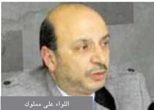
اللواء علي مملوك