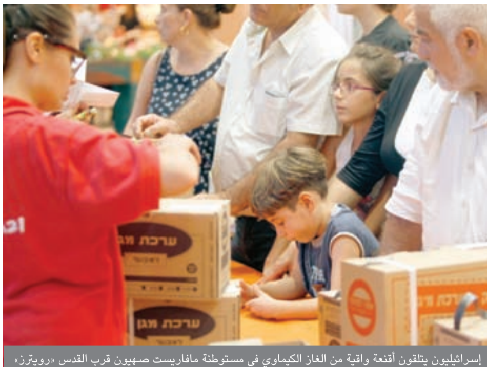
إسرائيليون يتلقون أذعة واقية من الغاز الكيماوي في مستوطنة مافاريسيت صهيون قرب القدس