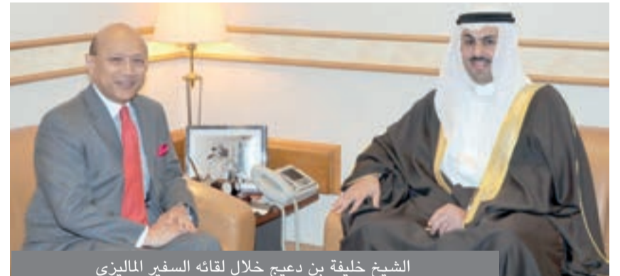
الشيخ خليفة بن ديعج خلال لقائه السفير الماليزي