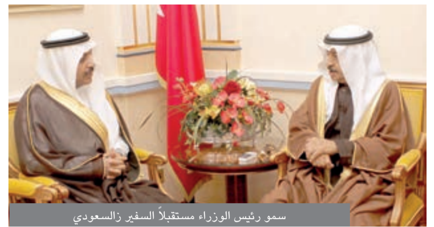
سمو رئيس الوزراء مستقبلاً السفير السعودي

وأكد سموه أن البحرين تعزز وتفخر بما لديها من كوادر بشرية وطنية مدربة ومؤهلة تعمل في القطاع المصرفي والمالي، وقد أثبتت كفاءتها في هذا المجال من جانبهم، أكد رئيس مجلس إدارة شركة بايندبرج للاستثمارات وأعضاء مجلس الإدارة، أن مملكة البحرين حققت سمعة عالمية كمركز مالي واقتصادي بفضل ما تتمتع به من بيئة تشريعية