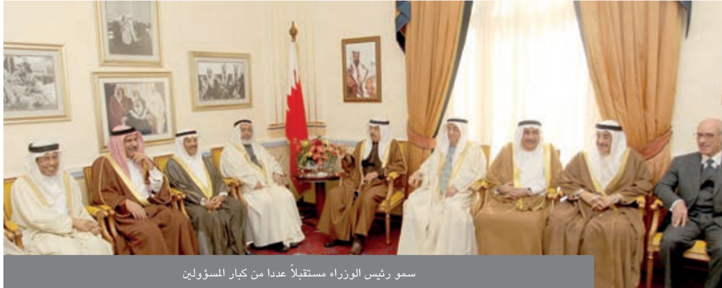
سمو رئيس الوزراء مستقبلاً عدداً من كبار المسؤولين

سموه على ضرورة أن تعكس أسماء هذه المناطق والأحياء عمقها التاريخي وبعدها الثقافي. إلى ذلك، فقد أكد صاحب السمو الملكي رئيس الوزراء دعم الحكومة لمجلس النواب وبخاصة ما يتعلق بدوره الرقابي، لافتاً سموه إلى أن الحكومة تعمل على تبني الأليات التي تترى هذا التعاون بما يصب في مصلحة المواطن ويديم المسيرة الديمقراطية في المملكة.